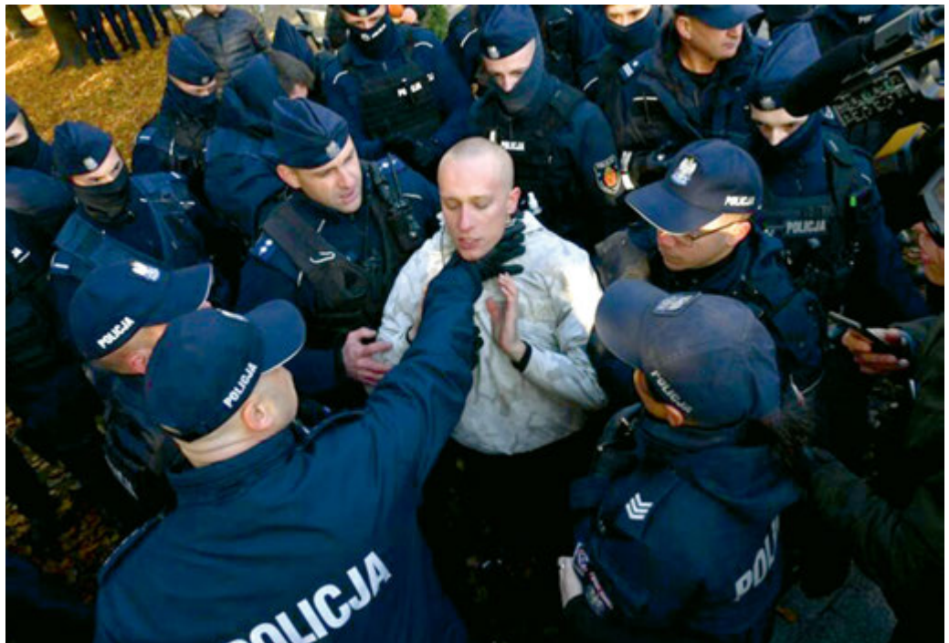
Grand Press Photo 2023. nagrada internautów.

Policjanci użyli siły wobec aktywisty Lotnej Brygady Opozycji w trakcie 150. miesięcznicy katastrofy smoleńskiej. 10 października 2022 r.