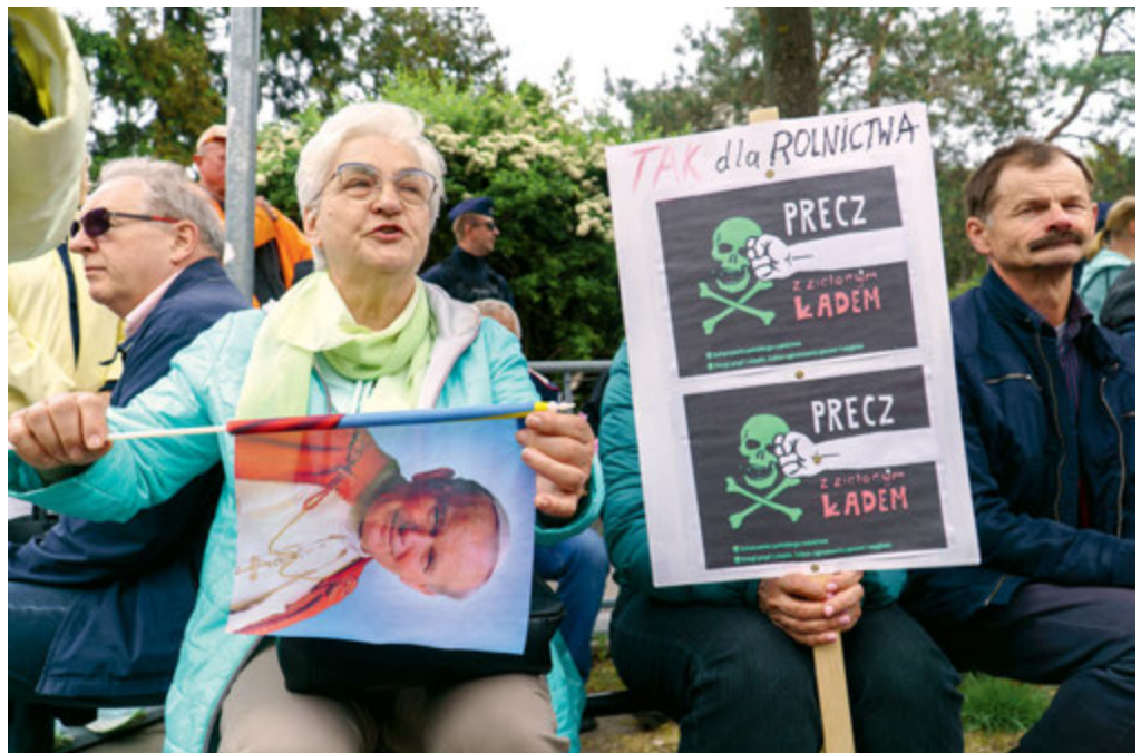
Warszawa, ulica Wiejska, zakończenie protestu przeciwko zapisom Zielonego Ładu. 10 maja 2024 r.