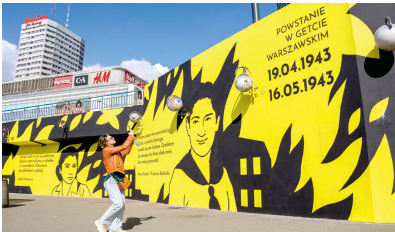
Mural przy stacji metra Centrum w Warszawie, stworzony z okazji 80. rocznicy wybuchu powstania w getcie.