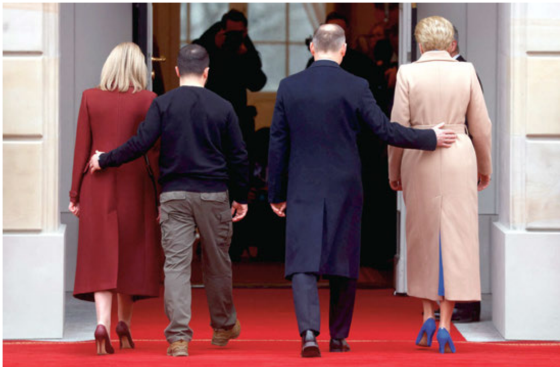
Panie pozwolą – Wołodymyr Zełenski i Andrzej Duda z żonami podczas oficjalnej wizyty prezydenta Ukrainy w Polsce. Warszawa, 5 kwietnia 2023 r.