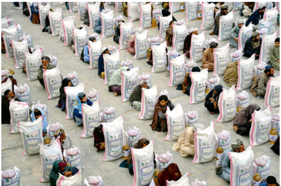
Afgańczycy z żywnością przekazaną przez organizację charytatywną podczas ramadanu. Kandahar, 9 marca 2025 r.