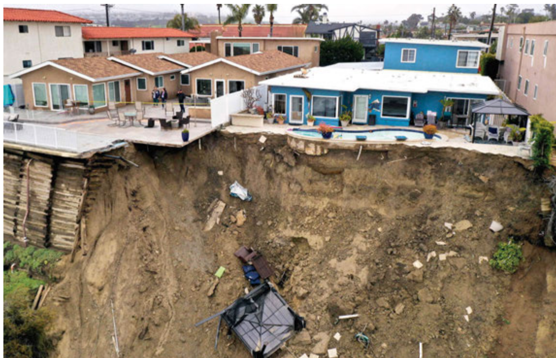
W Oceanside w Kalifornii potężne ulewy spowodowały osunięcie się ziemi. Mieszkańcy domów na wybrzeżu zostali ewakuowani. 15 marca 2023 r.