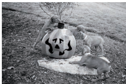
Miot szceniąt rasy wyżeł węgierski krótkowłosey bada swoje otoczenie

zanim postawiła go na ziemi. Udało jej się to przez kilka miesięcy, do czasu gdy właściciel budynku musiał wejść do jej mieszkania, by dokonać drobnej naprawy. Ups! Właściciel dał jej wybór: wyniesie się ona, pies albo oboje. W tym czasie kobieta była już bardzo przywiązana do psa, ale nie mogła znaleźć podobnego mieszkania z takim czynszem, na który byłoby ją stać. Podstawowa zasada brzmi: przeczytaj umowę .