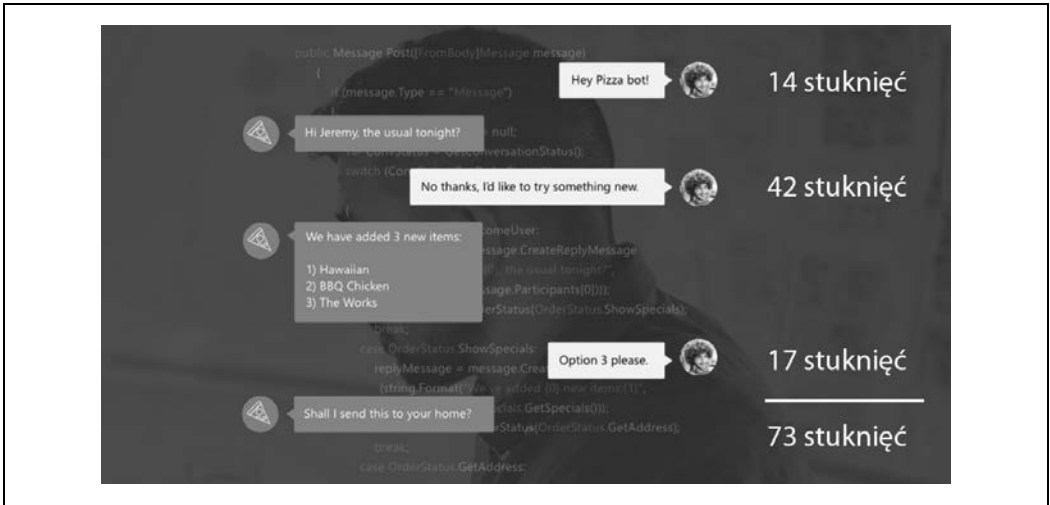
Rysunek 1.1. Przykład przygotowanego przez firmę Microsoft bota do zamawiania pizzy (adnotacje dodane przez Dana Grovera)