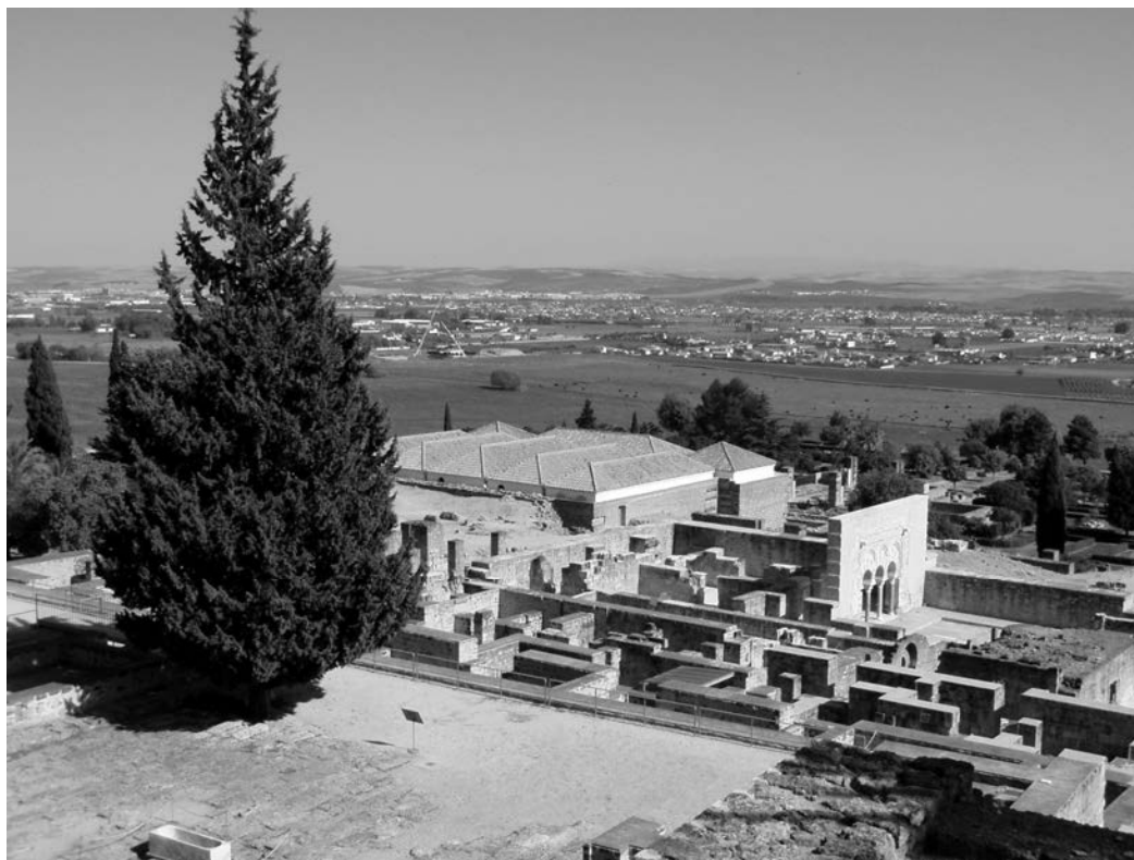
Rysunek 6.7. Teren wykopalisk archeologicznych (Madinat az-Zahra); częściowa rekonstrukcja zburzonego zamku. Dokonane na terenie wykopalisk znaleziska archeologiczne wymagają odpowiedniego zabezpieczenia, co często opóźnia prace projektowe oraz budowlane, ale daje możliwość pokazania tradycji miejsca

towych (przykładowo w trakcie prac odkrywkowych okazuje się, że na terenie projektowanym znaleziono artefakty archeologiczne; rysunek 6.7), nowych zasad finansowania całej inwestycji bądź też innych, trudnych do przewidzenia przyczyn.