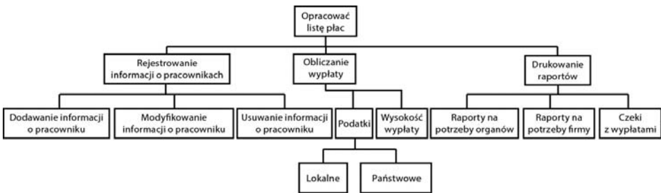
RYSUNEK 3.2. Pierwsza strona uzyskanego metodą od ogółu do szczegółu projektu programu kadrowo-płacowego obejmuje szczegóły z najwyższego poziomu

Przyjrzyj się rysunkowi 3.2. Może to być pierwsza strona projektu związanego z listą płac i uzyskanego metodą od ogółu do szczegółu. Każdy program płacowy musi obejmować mechanizmy do wprowadzania, usuwania i modyfikowania informacji o pracownikach — imienia i nazwiska, adresu, dni zwolnienia itd. Jakie jeszcze szczegółowe dane o pracownikach są potrzebne? Na tym etapie nie należy się tym zajmować. Projekt nie jest jeszcze do tego gotowy.