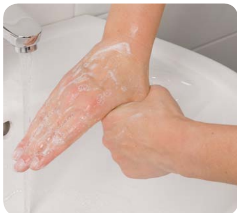
Zdj. 8. Kolejność higienicznego mycia i dezynfekcji rąk – krok 5