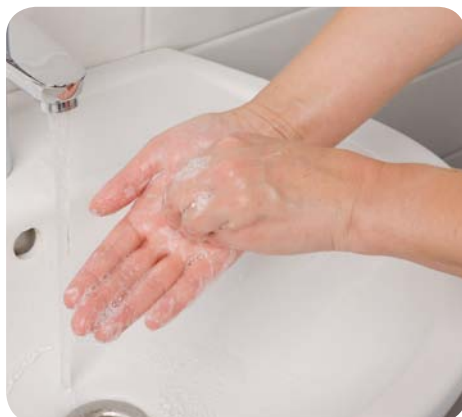
Zdj. 9. Kolejność higienicznego mycia i dezynfekcji rąk – krok 6