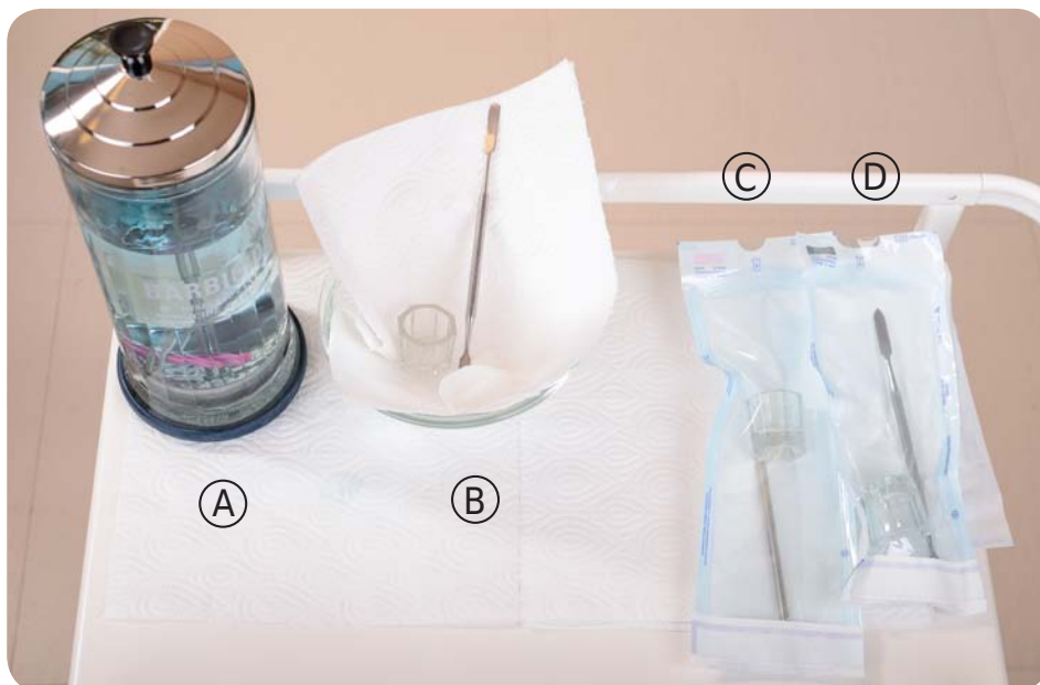
Zdj. 11. Dezynfekcja narzędzi (A. narzędzia w dezynfekcji chemicznej, B. narzędzia po osuszeniu, C. przygotowanie do sterylizacji, D. narzędzia po sterylizacji)