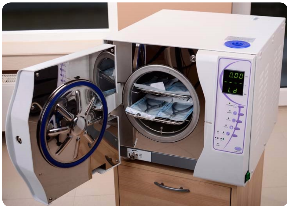
Zdj. 1. Autoklaw otwarty