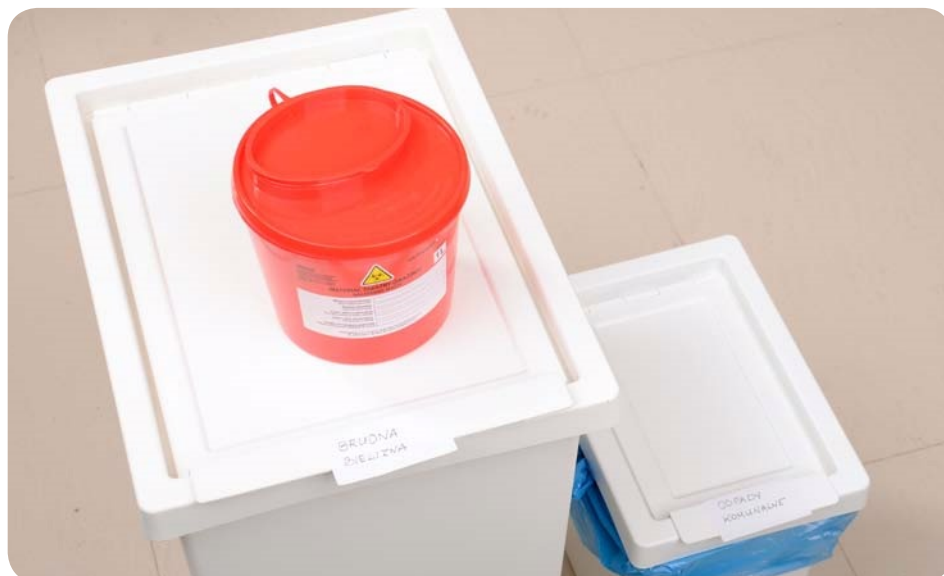
Zdj. 3. Kosze na odpady

W gabinecie kosmetycznym zakazane jest palenie papierosów i wprowadzanie do niego zwierząt.