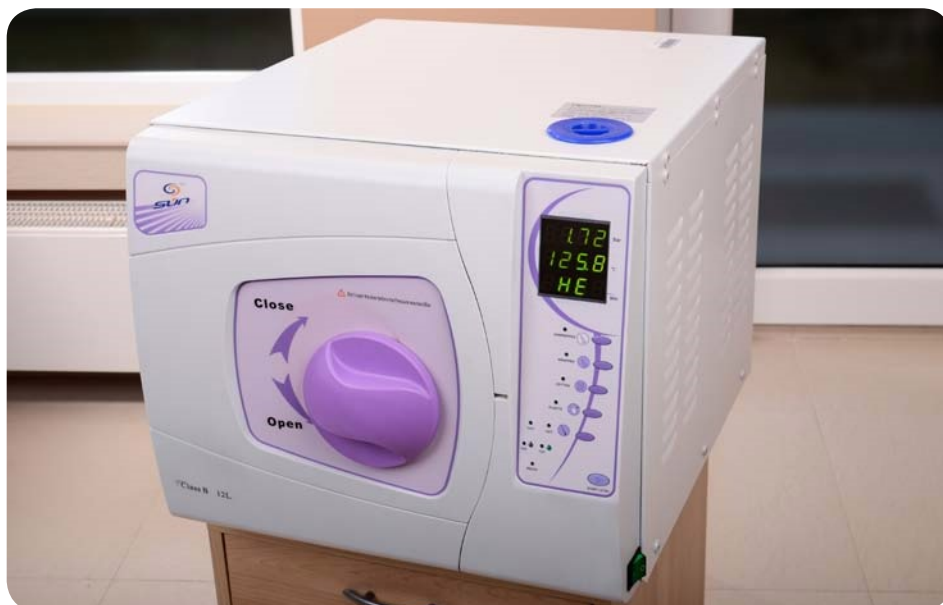
Zdj. 2. Autoklaw zamknięty

Przybory kosmetyczne stosowane przy wykonywaniu zabiegów dzieli się na: