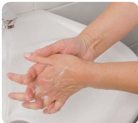
Zdj. 6. Kolejność higienicznego mycia i dezynfekcji rąk – krok 3