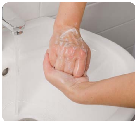
Zdj. 7. Kolejność higienicznego mycia i dezynfekcji rąk – krok 4