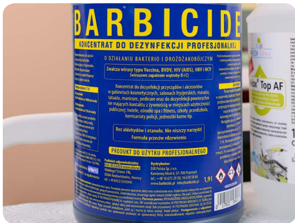
Zdj. 12. Etykiety środków do dezynfekcji – przykład I