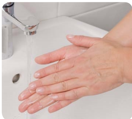
Zdj. 4. Kolejność higienicznego mycia i dezynfekcji rąk – krok 1