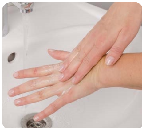
Zdj. 5. Kolejność higienicznego mycia i dezynfekcji rąk – krok 2