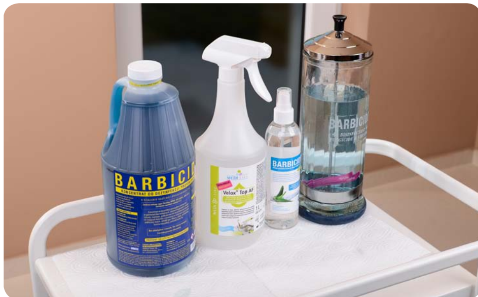
Zdj. 10. Środki do dezynfekcji