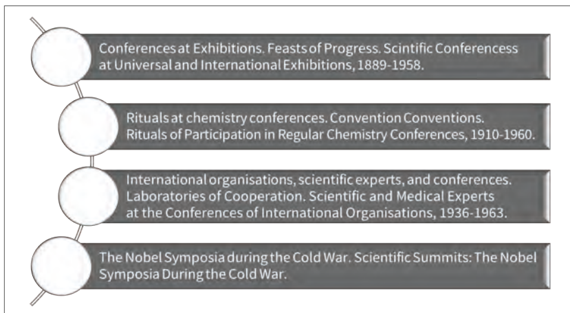
Ilustracja 1. Case studies projektu The Scientific Conference: A Social, Cultural, and Political History

rencji chemicznych), instytucjonalizacja i profesjonalizacja (samoorganizacja) w obrębie nauki, jak również recepcja Nagrody Nobla w świetle zimnowojennego napięcia politycznego.