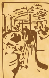
Pracownicy w autobusie G.M.C.