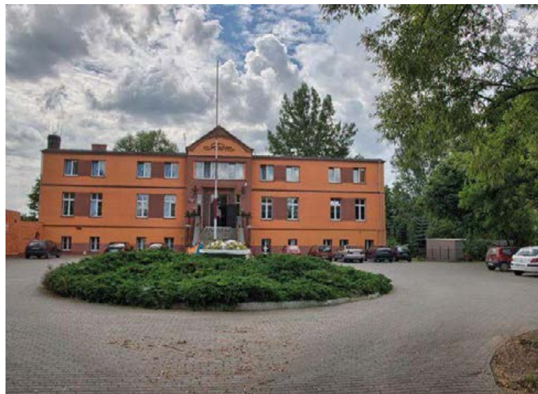
↗ Dwór w Skubarczewie

Rano ruszamy w dalszą trasę. Drogą między dwiema częściami jeziora wjeżdżamy na cypel Ostrowo lub inaczej Półwysep Ostrowski. Wieś Ostrowo znajduje się na terenie Powidzkiego Parku