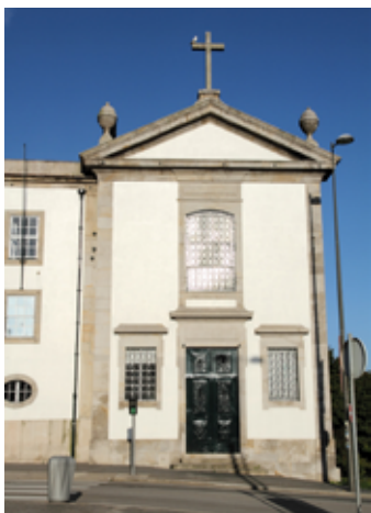
▲ Kaplica Krawców

Wracając na Rua de Saraiva de Carvalho i skręcając w Rua de Augusto Rosa,