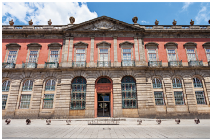
▲ Narodowe Muzeum Soares dos Reis ma siedzibę w dawnej rezydencji rodu Carrancas

Za szpitalem św. Antoniego ciągnie się Rua de Dom Manuel II, przy której pod