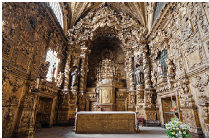
▲ Wnętrze kościoła św. Klary