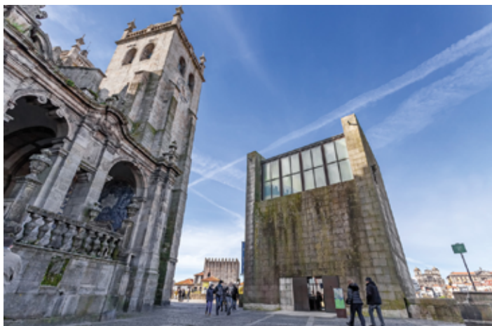
▲ Stary Ratusz Miejski – symbol dawnych epok

W odległości kilku metrów od północnej wieży katedry, po prawej stronie Terreiro da Sé, wznosi się Stary Ratusz Miejski (Antiga Casa da Câmara). Niekiedy bywa on nazywany Domem Dwudziestu Czerech (Casa dos 24), co stanowi nawiązanie do czasów, w których zbierało się w nim 24 przedstawicieli różnych cechów miejskich. Pierwotny obiekt, którego budowę sfinansowano dzięki zyskom z podatków od handlu winem, powstał w XV w. tuż przy starych murach miejskich. Wieża Związków (Torre da Relação), bo i tak go nazywano, była pierwszą siedzibą lokalnych władz miejskich. W 1875 r. ratusz został zniszczony przez pożar i przetrwał w ruinie aż do 2000 r., kiedy na części pozostałych gruzów zaczęto wznosić obecny budynek. Obiekt, zaprojektowany przez architekta Fernando Távora, oddano do użytku w 2002 r. Aktualnie działa w nim punkt informacji turystycznej 📍 Terreiro da Sé; www.visitporto.travel ; otwarte: XI–IV codz. 9.00–19.00, V–X codz. 9.00–20.00.