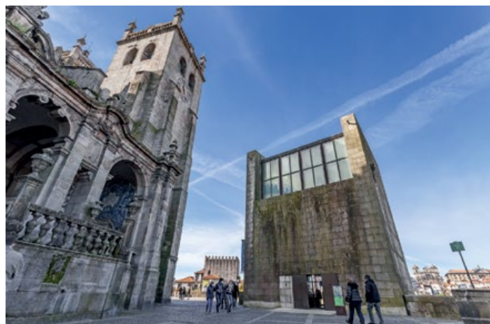
▲ Stary Ratusz Miejski – symbol dawnych epok

W odległości kilku metrów od północnej wieży katedry, po prawej stronie Terreiro da Sé, wznosi się Stary Ratusz Miejski (Antiga Casa da Câmara). Niekiedy bywa on nazywany Domem Dwudziestu Czerech (Casa dos 24), co stanowi nawiązanie do czasów, w których zbierało się w nim 24 przedstawiciele różnych cechów miejskich. Pierwotny obiekt, którego budowę sfinansowano dzięki zyskom z podatków od handlu winem, powstał w XV w. tuż przy starych murach miejskich. Wieża Związków (Torre da Relação), bo i tak go nazywano, była pierwszą siedzibą lokalnych władz miejskich. W 1875 r. ratusz został zniszczony przez pożar i przetrwał w ruinie aż do 2000 r., kiedy na części pozostałych gruzów zaczęto wznosić obecny budynek. Obiekt, zaprojektowany przez architekta Fernando Távora, oddano do użytku w 2002 r. Aktualnie działa w nim punkt informacji turystycznej i Terreiro da Sé ; www.visitporto.travel ; otwarte: XI–IV codz. 9.00–19.00, V–X codz. 9.00–20.00.