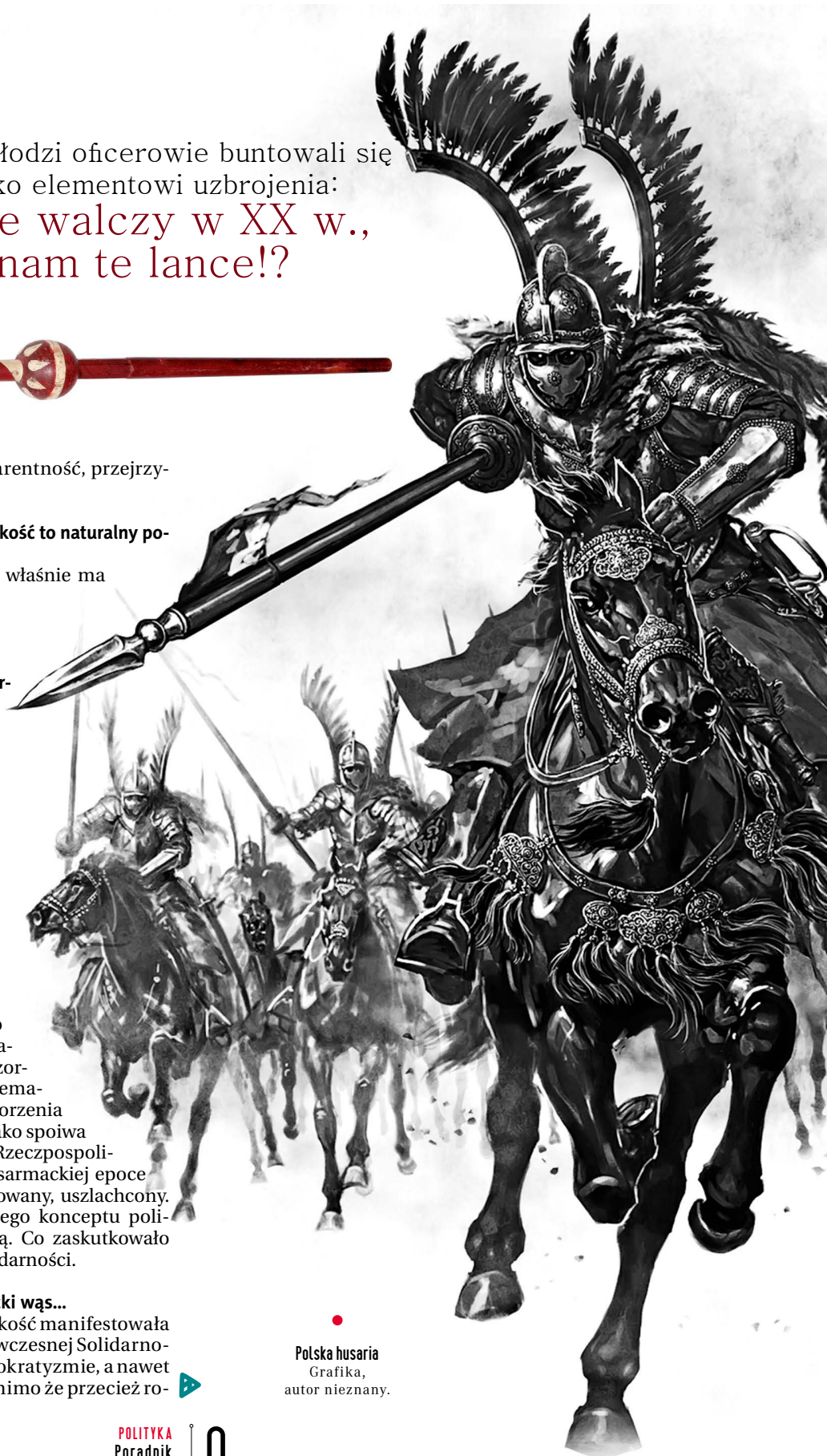
● Polska husaria Grafika, autor nieznany.

...tu nie tylko o wąs chodzi. Sarmackość manifestowała się też np. w charakterystycznym dla wczesnej Solidarności kulcie maryjnym, wiecowym demokratyzmie, a nawet w podziale na regiony. Ta rewolucja, mimo że przecież ro-