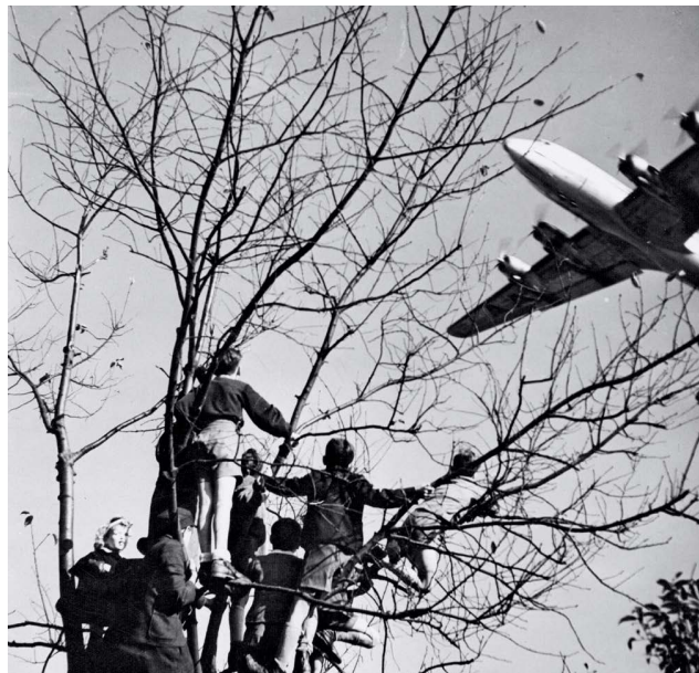
Młodzi berlińczycy oglądają amerykański samolot z pomocą dla zachodnich sektorów miasta podczas zarządzanej przez Stalina blokady Berlina, okolice Bramy Brandenburskiej, czerwiec 1948 r.

28 czerwca Wykluczenie Komunistycznej Partii Jugosławii z Kominformu; Jugosławia pod rządami Josipa Broz-Tity odłączyła się od kontrolowanego przez Stalina bloku wschodniego.