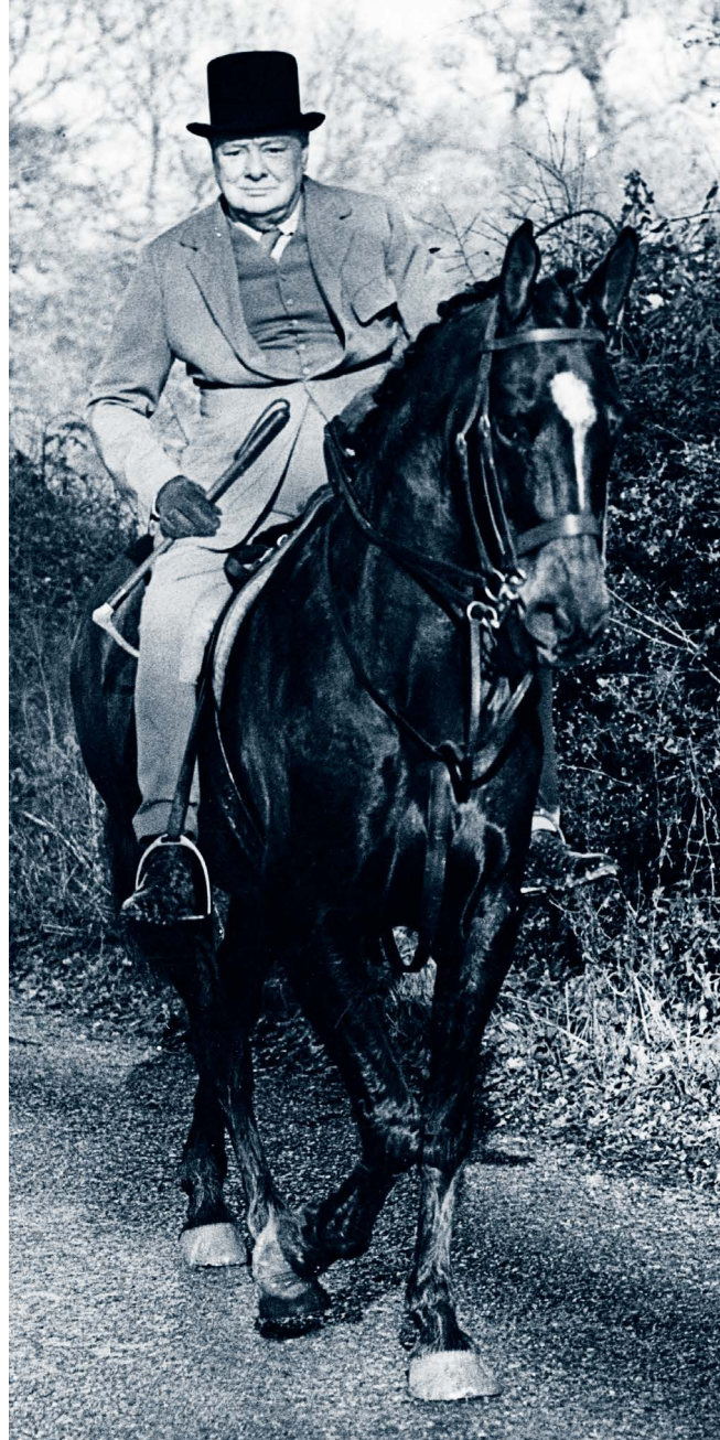
❖ Winston Churchill w swej posiadłości Chartwell, 1948 r.