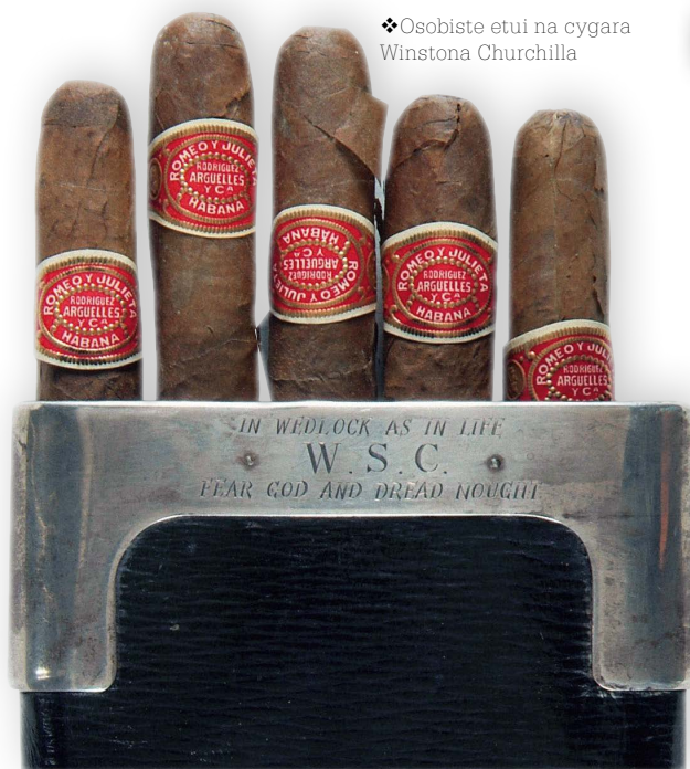
❖Osobiste etui na cygara Winstona Churchilla