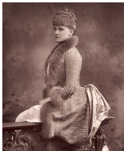
❖ Jedna z licznych kochanek Edwarda, Frances Greville, hrabina Warwick, zwana Stokrotką (Daisy), tu jako Lady Brook, przełom XIX i XX w.