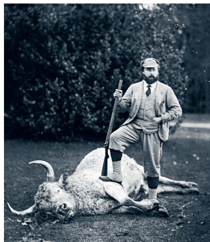
❖ Monarszy symbol nowej epoki, księżę Walii, przyszły król Edward VII, miłośnik jedzenia, kobiet i wszelkich uciech, tu z ustrzelonym przez siebie dzikim bykiem, ok. 1879 r.