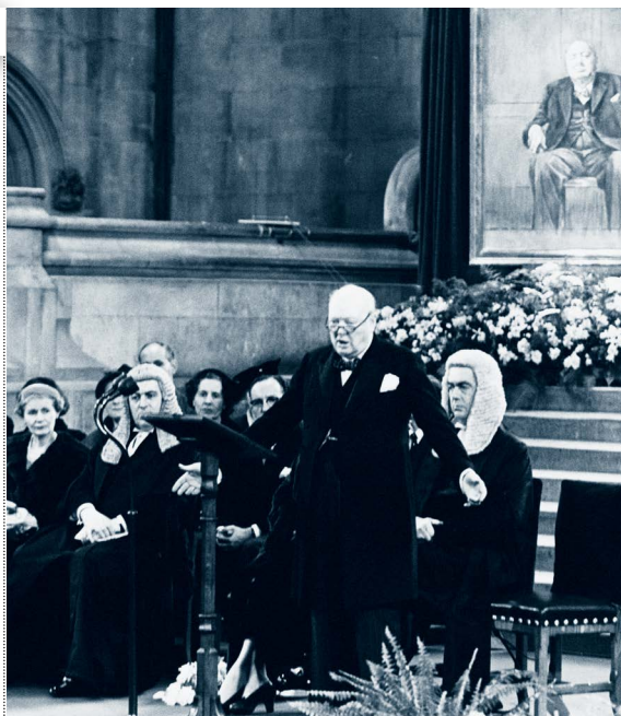
❖Winston Churchill na swych 80 urodzinach, listopad 1954 r.