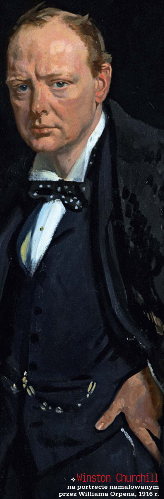
❖ Winston Churchill na portrecie namalowanym przez Williama Orpena, 1916 r.