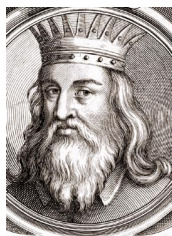
Kazimierz Wielki, ostatni z dynastycznej linii Piastów, umiera bezpotomnie w 1370 r. Być może klucz do zrozumienia fenomenu przyszłej unii polsko-litewskiej leży w wygasaniu kolejnych dynastii.

DROGA DO UNII – PRZYWILEJ KOSZYCKI. Sytuacja zdawała się opanowana w XIV w., kiedy Władysław Łokietek zjednoczył główne dzielnice państwa i w 1320 r. koronował się w Krakowie na króla Polski. Zwolennicy dziedziczenia tronu i silnej władzy królewskiej mogli być zadowoleni. Nawet bezpotomna śmierć Kazimierza Wielkiego w 1370 r. nie naruszała zbytnio porządku rzeczy, gdyż król zdążył przekazać swe prawa do tronu siostrzeńcowi Ludwikowi Andegaweńskiemu. Krótkotrwała unia polsko-węgierska nie ma dla nas w tym miejscu większego znaczenia – choć mogła odciągnąć uwagę Polski od Litwy, z którą notabene namiętnie wojowaliśmy