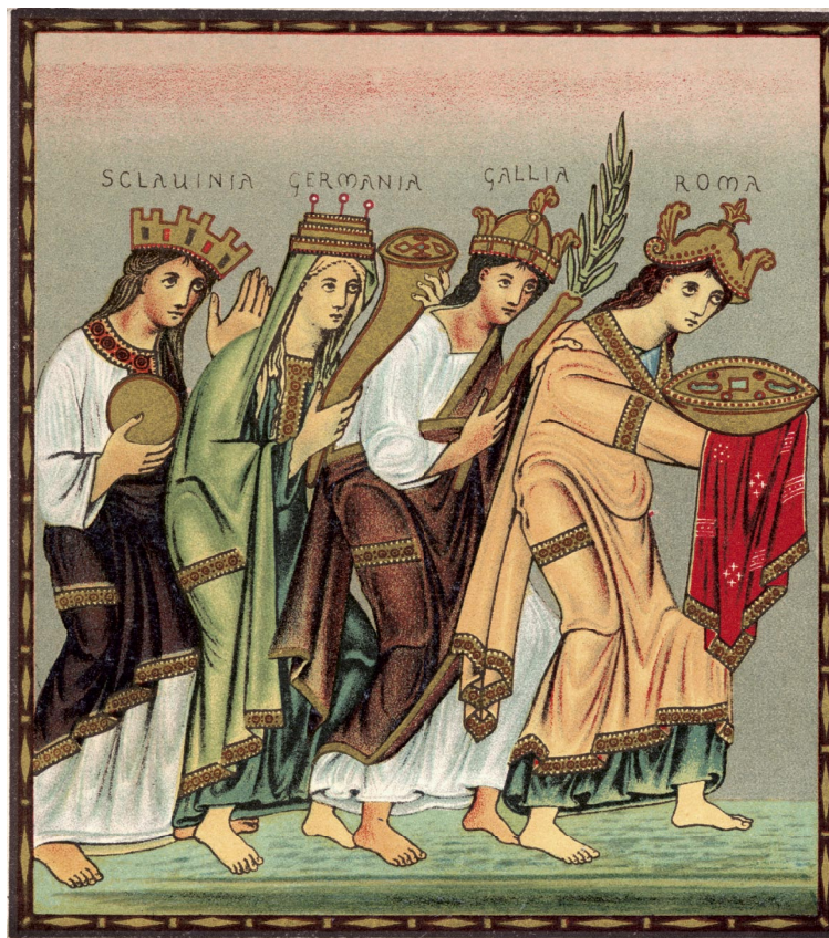
Roma, Gallia, Germania, Scлавinia; wyobrażenie czterech prowincji składających hołd cesarzowi Ottonowi III. Iluminowany manuskrypt z klasztoru Reichenau, z końca X w. Młodsza Europa już w pochodzie historii.

To oswojenie się z różnorodnością stało się atutem, gdy okoliczności dziejowe spłotyły losy Polski i Litwy. Związek dwóch państw, odmiennych historią, obyczajem, językiem, strukturą społeczną, wydawać by się mógł tworem sztucznym, nierokującym długiego trwania. Jego zrządzenie się, rozpoczęte w 1386 r. wyborem księcia Jagielly na króla Polski i jego chrztem w obrządku katolickim, trwało długo, wewnętrzne konflikty były stałym elementem jego dziejów. Ostatecznie jednak wspólne interesy gospodarcze, polityczne, atrakcyjność przywilejów uzyskiwanych przez polskie rycerstwo doprowadziły do powstania wspólnego państwa. Zapewne najważniejszym etapem na tej drodze