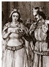
Ślub Jadwigi i Jagiełły, 1386 r. Wprowadzonej na tron Polski Andegawence szukano męża, dzięki któremu urodzi następcę tronu. Tak dochodzi do unii (na razie personalnej) z Litwą.

Od przybytku głowa nie boli, w tym przypadku jednak nie bardzo było wiadomo, jaki będzie los królew-