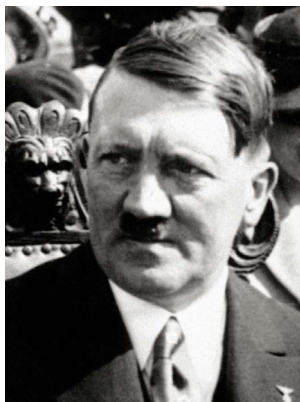
Adolf Hitler podczas tzw. Dnia Poczdamu, 1933 r.