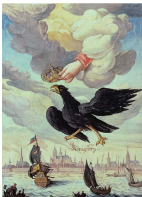
Pruski orzeł na tle panoramy Królewca. Alegoria koronacji na króla w Prusach, 1701 r.