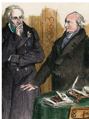
Karl von Hardenberg i Karl von Stein, inicjatorzy reform ustrojowych.