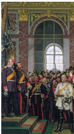
Proklamacja Cesarstwa Niemieckiego w Sali Lustrzanej w pałacu w Wersalu, 1871 r.