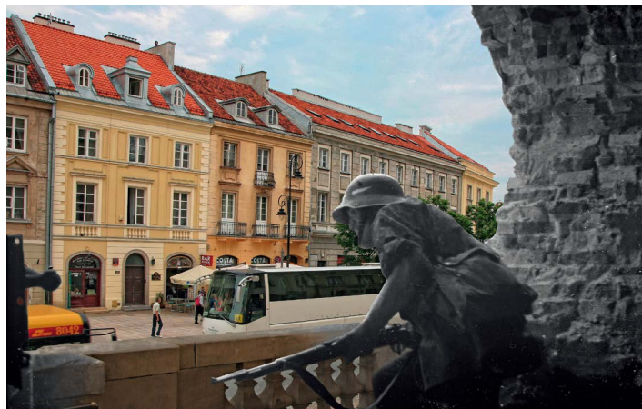
Historyczne zdjęcia z Powstania Warszawskiego wkomponowane we współczesne fotografie dokładnie tych samych miejsc na mapie stolicy Polski; z projektu „Teraz 44. Historie” fotografa Marcina Dziedzica oraz historyka i dziennikarza Michała Wójcika.