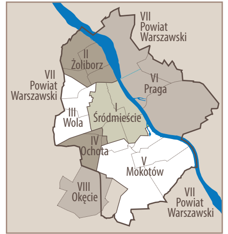
Podział Okręgu Warszawskiego Armii Krajowej na obwoły (art. s. 54)