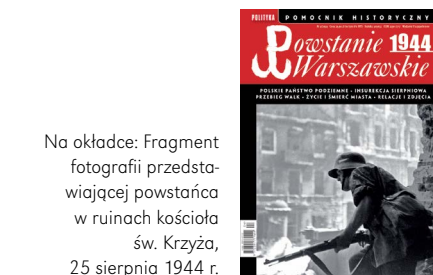
Na okładce: Fragment fotografii przedstawiającej powstańca w ruinach kościoła św. Krzyża, 25 sierpnia 1944 r.