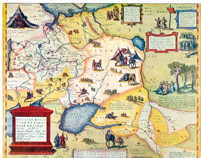
„Opis Rusi, Moskowii i Tartarii”, mapa z 1562 r., wydrukowana w 1571 r. przez Abrahama Orteliusa w Antwerpii.