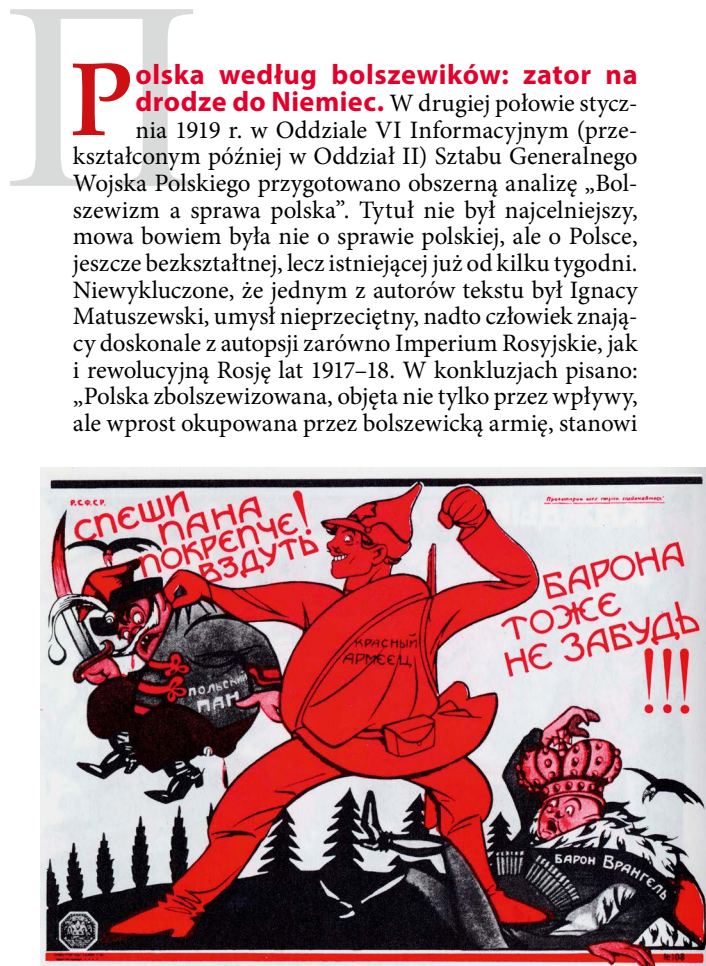
Krasnoarmiejec bijący polskich panów i rosyjskich baronów; plakat bolszewicki z 1920 r. Obok: Bitwa Warszawska w sierpniu 1920 r. na obrazie „Cud nad Wisłą” Jerzego Kossaka z 1930 r.

naturalną drogę do ekspansji dla rewolucji rosyjskiej, natomiast ekspansja ta, stanowiąca kwestię życia lub śmierci dla bolszewizmu, nigdy się uskuteczyć nie może bez ujarznienia Polski. Przed armią sowietów staje zadanie poważne: bezpośredniego przeniesienia rewolucji do Polski, a więc na zewnątrz Rosji. Wedle koncepcji politycznej bolszewików Polska wejdzie w skład federacyjnej socjalistycznej republiki sowietów w charakterze jej składowej części, jak Litwa, Ruś [Ukraina], Łotwa i t. d.