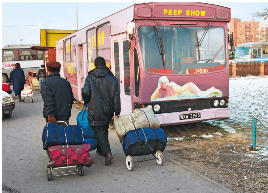
Okolice dworca autobusowego Warszawa Stadion, grudzień 1993 r.

„Czy lubi Pani Atlas, czy Atlas Pani zna? Ja Pani wytłumaczę, co Atlas Pani da!” – śpiewał Andrzej Rosiewicz w telewizyjnej reklamie kleju. Mężczyźni tłumaczyli kobietom, dlaczego taki proszek do prania usunie wszelki brud, a taka pasta do zębów jest lepsza od innych (wtedy występowały w kitlach lekarskich). Przejęte i uszczęśliwione gospodynie z ekranu przyjmowały te dobrodziejstwa, wprowadzające do nowego życia, obowiązkowo rodzinnego, wokół stołu w pięknej kuchni. Bohaterowie reklam często poruszali ustami w rytm zdań niemieckich czy angielskich, a nie polskich, ale szczerze cieszyli się cukierka-