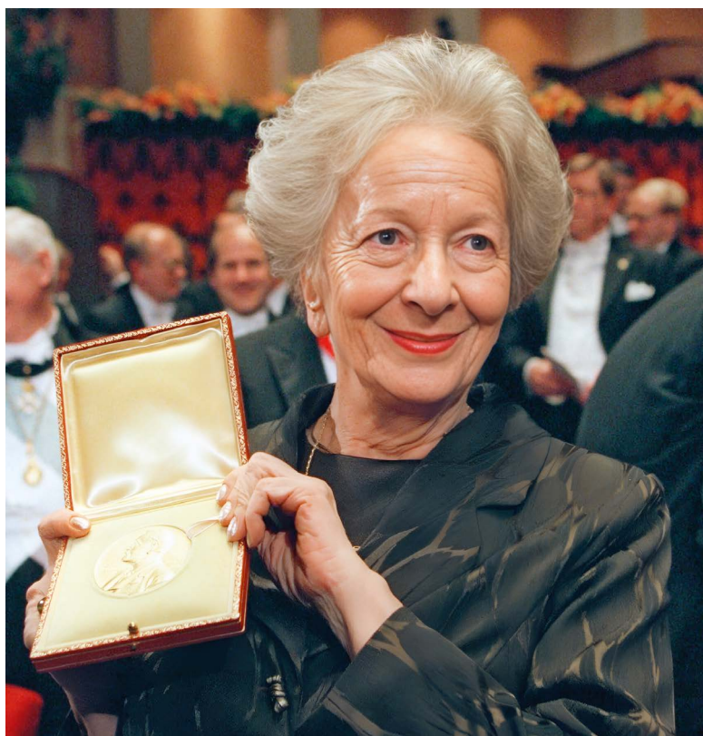
Od lewej, od góry: Godło Polski w sali posiedzeń Sejmu; orzeł odzyskał koronę 31 grudnia 1989 r. • Reżyser Andrzej Wajda na planie zdjęciowym filmu „Pan Tadeusz” według Adama Mickiewicza, Łomianki, lipiec 1998 r. • Poetka Wisława Szymborska z medalem literackiej nagrody Nobla, Sztokholm, grudzień 1996 r.