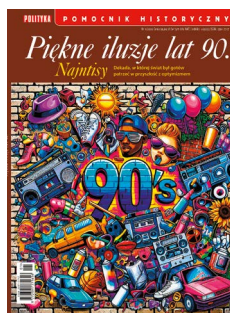
Na okładce: Popkulturowe symbole i gadżety z lat 90. XX w.