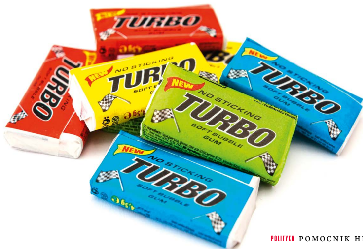
Guma do żucia.

Meblówianki, na które jeszcze kilka lat wcześniej czekano w kolejkach społecznych, straciły swój urok. Usuwano boazerie, oznakę dobrostanu lat 70., a także ozdoby w rodzaju mat na ścianie z wpiętymi znaczkami klubów sportowych czy wiklinowe pająki. Likwidowano zasłonki z plastikowych kolorowych pasków albo drewnianych koralików, zastępujące drzwi do kuchni. Zrywano posadzki z lenteksu, kładziono panele. W drugiej połowie lat 90. by-