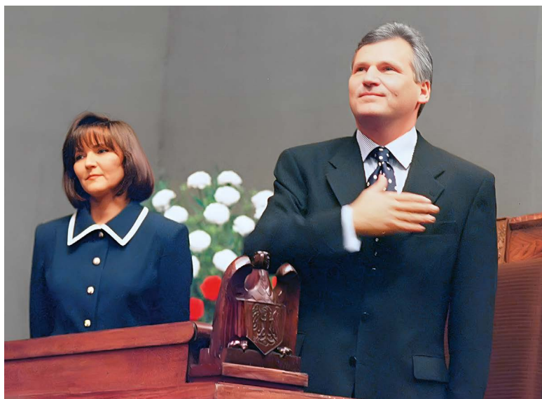
Od lewej: Lech Wałęsa, prezydent RP 1990-95, wraz z żoną Danutą podczas składania prezydenckiej przysięgi przed Zgromadzeniem Narodowym, 22 grudnia 1990 r. • Aleksander Kwaśniewski, prezydent RP 1995-2005, wraz z żoną Jolantą podczas składania prezydenckiej przysięgi przed Zgromadzeniem Narodowym, 23 grudnia 1995 r.