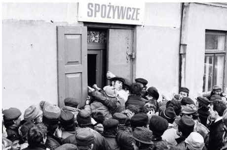
Otwarcie sklepu spożywczego w Skaryszewie, marzec 1990 r.

W banku na placu Powstańców w Warszawie kolejki nie mniejsze niż pod koniec ubiegłego roku. (...) Część klientów jest jednak wyraźnie zdezorientowana. Nie rozumie, co się tutaj dzieje ze skupem i sprzedażą dolarów. W banku jednocześnie, na tej samej sali, odbywa się skup po kursie oficjalnym, czyli po 9310 zł, działa kantor, który za dolara płaci 9200 zł, a przed drzwiami kłębią się konie,