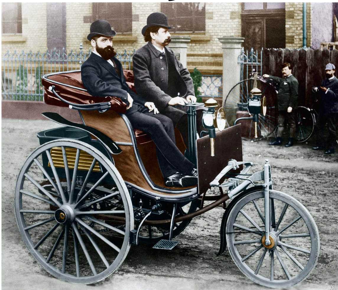
❖ Spalinowy trójkołowiec Carla Friedricha Benza, konstruktor po prawej, 1887 r.