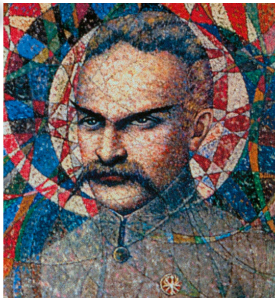
❖ „Józef Piłsudski”, obraz Bolesława Biegasa, 1945/46 r.

❖ Maciejówka i szabla Józefa Piłsudskiego. Maciejówka – czapka z okrągłym denkiem wykonana z sukna, z paskiem lub sznurem nad sztywnym daszkiem. W XIX w. była popularnym nakryciem głowy na wsiach (stąd nazwa: noszona przez Maciejów, chłopów). Przyjęli ją członkowie organizacji strzeleckich i żołnierze Legionów Polskich, w kolorze – jak i całego umundurowania – szarym („Jedzie, jedzie na Kasztance/siwym strzelca strój” – tak zaczyna się popularna wśród legionistów piosenka z 1915 r.).