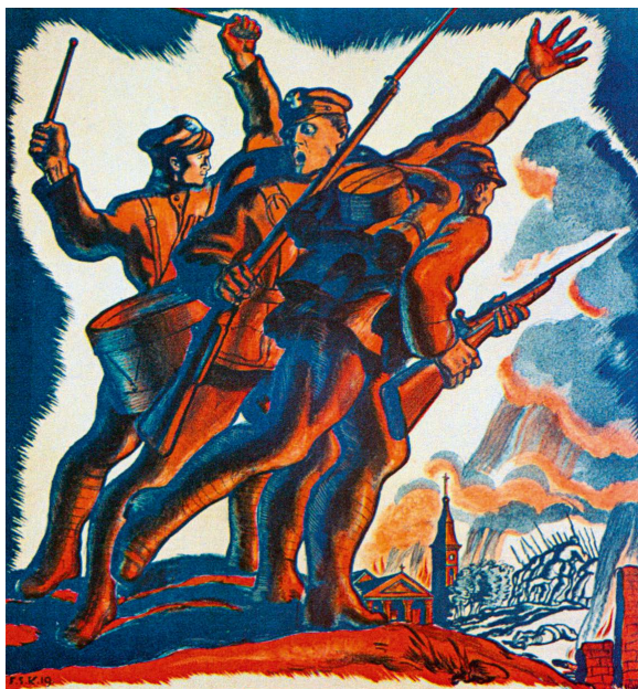
❖ „Do broni! Wstępujcie do wojska polskiego!”, plakat propagandowy Filipa Szczęsnego Kowalskiego, 1919 r.