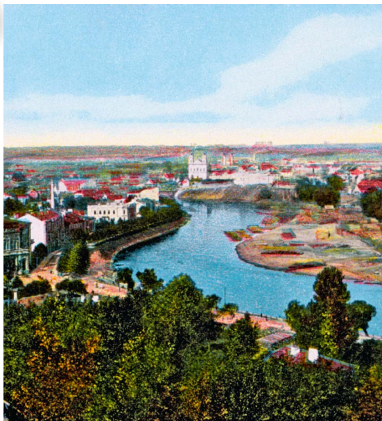
❖ Wilno, 1900 r.