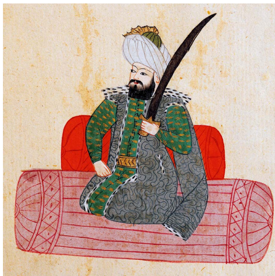
Osman I (XIII/XIV w.), założyciel dynastii i pierwszy sułtan imperium; ilustracja z arabskiego manuskryptu, XVII w.