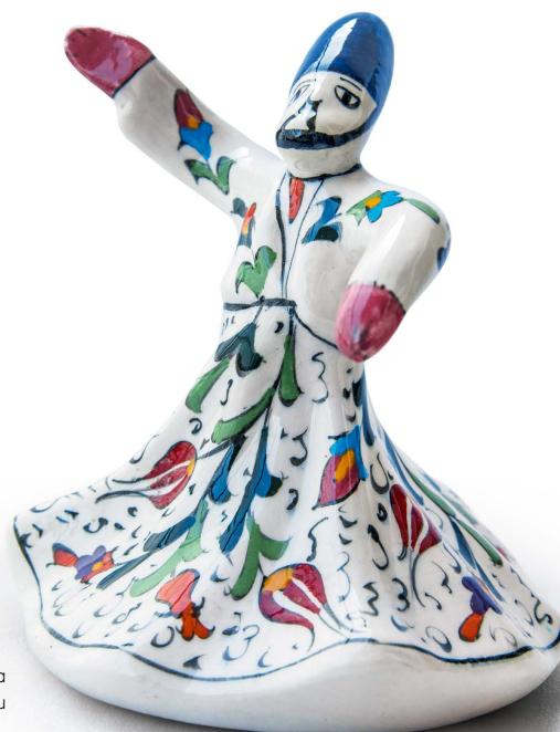
Współczesna figurka ze Stambułu

Leszek Będkowski Redaktor POMOCNIKÓW HISTORYCZNYCH