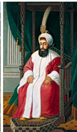
Od lewej: Bajezyd II (XV/XVI w.) na portrecie Abdulcelila Levniego z XVIII w. Orszak sułtański uwieczniony przez Jeana-Baptistę van Moura, francuskiego malarza w Wysokiej Porcie w XVIII w. Selim III (XVIII w.) na portrecie Josepha Warnia-Zarzeckiego, polskiego wykładowcy Szkoły Sztuk Pięknych w Sztambule w XIX w.

1699 Pokój karłowicki; koniec ekspansji terytorialnej Imperium Osmańskiego.