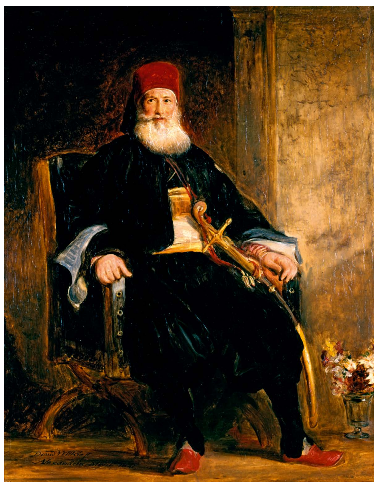
Muhammad Ali, pasza Egiptu; portret Davida Wilkiego, XIX w.

ferman, firman – dokument sułtański, rozporządzenie; opatrzone → tuğrą sułtana, napisany specjalnym kancelaryjnym rodzajem pisma ( divani )