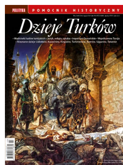
Na okładce: „Wkroczenie sułtana Mehmeda II do Konstantynopola w dniu 29 maja 1453 r.”; obraz Jean-Josepha Constanta, XIX w.