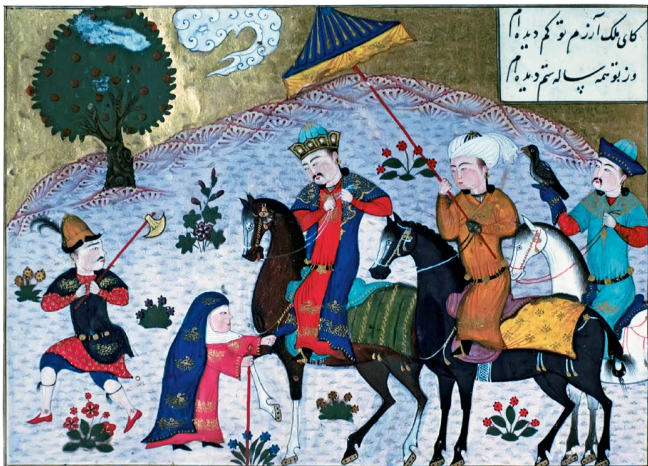
Sandżar, ostatni sułtan Wielkich Seldżuków (XII w.); perska miniatura z epoki