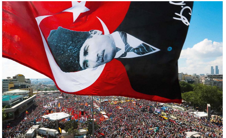
Antyrządowe protesty w Stambule pod flagą z podobizną Mustafy Kemala Atatürka, ojca nowoczesnej Turcji, 2013 r.