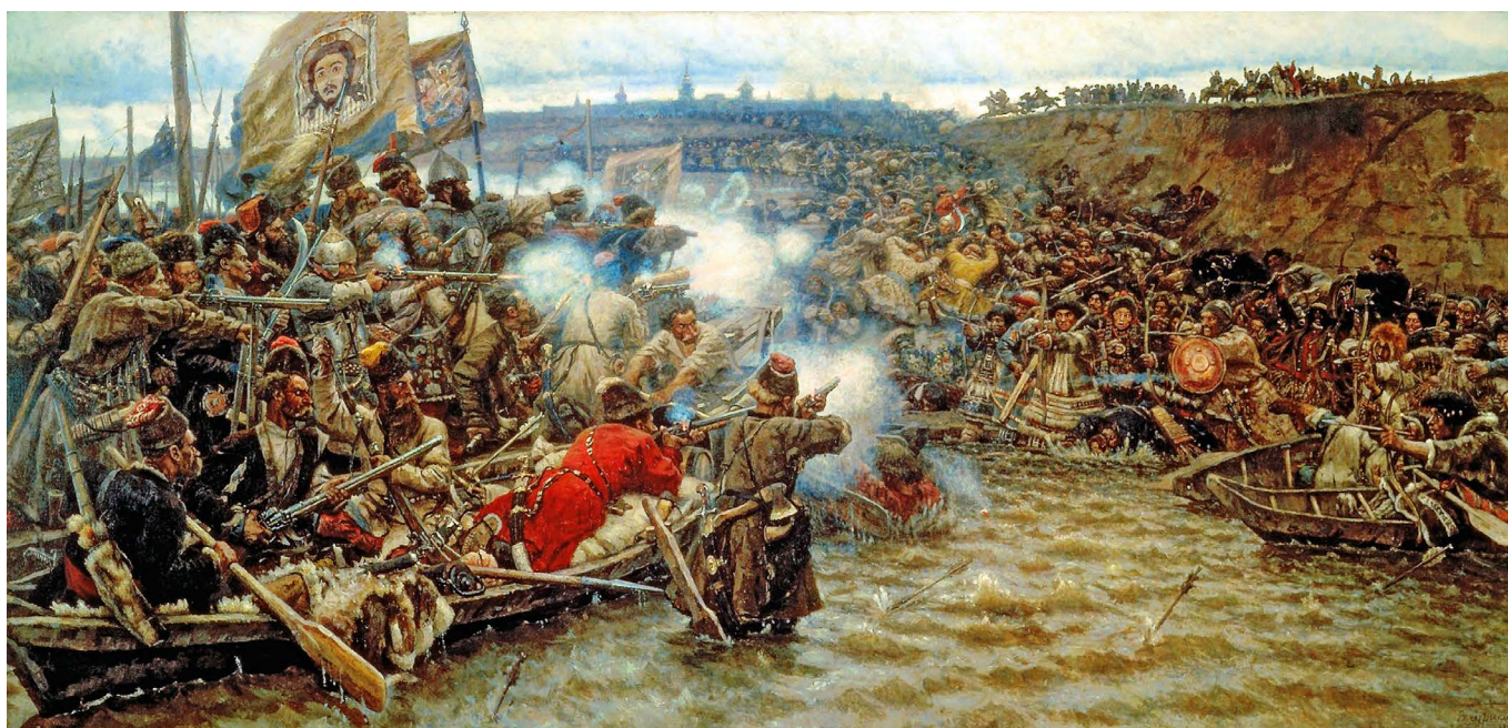
Podbój Syberii; obraz Wasilija Surikowa z 1899 r.