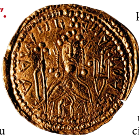
Zołotnik, moneta Włodzimierza Wielkiego, przełom X/XI w.

Wareski przyczółek. Latopisarska narracja miała za cel uzasadnić przyrodzony charakter dynastii Rurykowiczów i połączyć w jednolitą całość rozliczne tradycje etniczne i państwowe: oto w czasach, gdy normański element został już niemal całkowicie wchłonięty przez słowiańsko-ugrofiński ocean, pamięć o wojowniczych