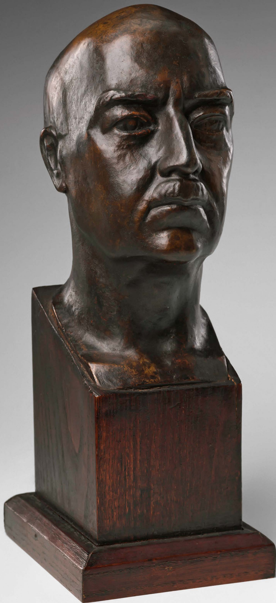
Gabriel Narutowicz, popiersie autorstwa Edwarda Wittiga, 1932 r. (O rzeźbiarzu – art. s. 73).