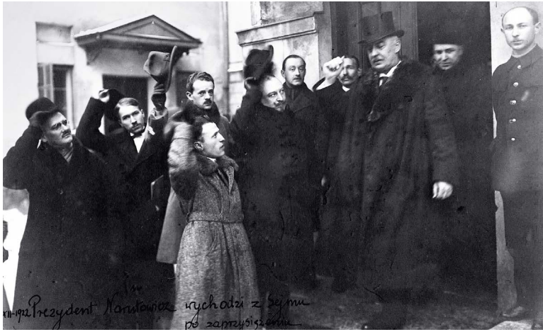
Gabriel Narutowicz przed gmachem sejmu po zaprzysiężeniu na urząd Prezydenta RP, Warszawa, 11 grudnia 1922 r.