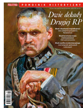
Na okładce: Józef Piłsudski sportretowany przez Wojciecha Kossaka, 1928 r.