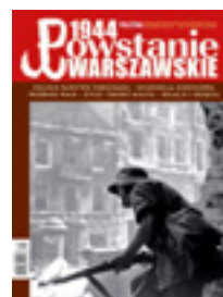
Na okładce: Fragment fotografii przedstawiającej powstańca w ruinach kościoła św. Krzyża, 25 sierpnia 1944 r.

Z ocywistych względów, ze względu na charakter i przebieg Powstania Warszawskiego, wszelkie dane liczbowe z tego czasu są obciążone pewnym ryzykiem błędu, należy je czasami traktować jako przybliżone, w literaturze pojawiają się zresztą różne liczby dotyczące tych samych zagadnień. Należy także pamiętać o subiektywnym charakterze wspomnień poszczególnych osób, czasami pewne detale odbiegają od szczegółowych ustaleń historyków, ale w tym wypadku chodzi raczej o odtworzenie nastroju tamtych dni.