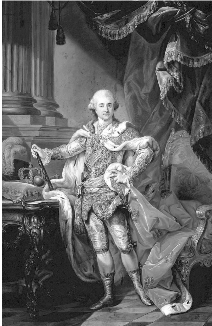
Czy Stanisława Augusta Poniatowskiego można uznać za króla suwerennego państwa?

stopniu było sankcjonowane przepisami prawa wewnętrznego. Te regulacje prawne co do „budowy socjalizmu” czy pogłębiania „demokracji socjalistycznej” były dość uciążliwe, lecz w zakresie realnego sprawowania władzy coraz mniej istotne. Po proklamowaniu stanu wojennego w grudniu 1981 roku nikt spośród rządzącej elity nie zawracał już sobie tym głowy – mimo utrzymującej się retoryki prosocjalistycznej.