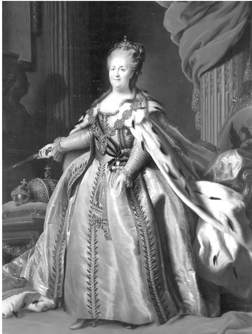
W Rosji Katarzyna Wielka, w Polsce tylko Katarzyna II. Mało kto wie, że to nie ona była inicjatorką rozbiorów Polski.