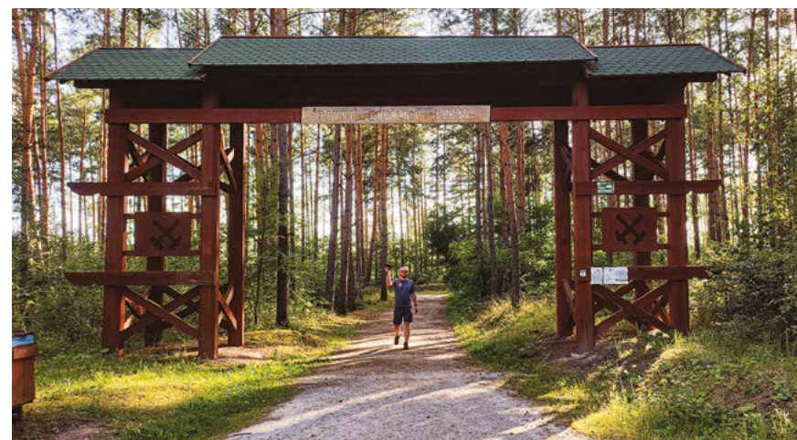
✘ Brama na geotrasie „Dawna Kopalnia Balbina”

zrobił tu największe zamieszanie. Przez wiele lat teren ten był mocno eksploatowany, a wiele dzisiejszych przyrodniczych zachwytności nierozwrotnie łączy się z wydobywaniem węgla brunatnego.