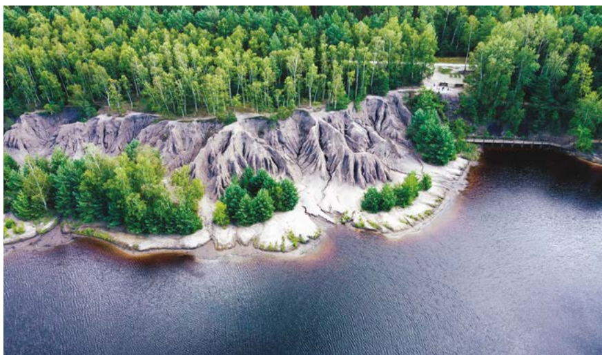
✘ Park Krajobrazowy Łuk Mużakowa