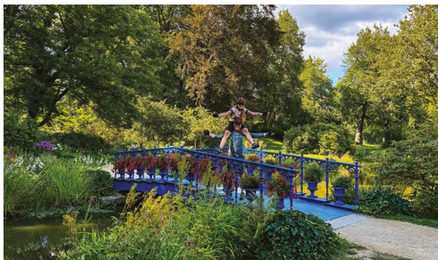
Okolice zamku Hermanna von Pücklera