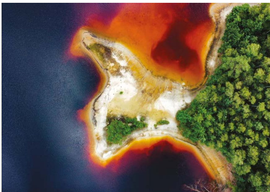
✘ Zbiornik Afryka

parkiem z odbudowywanym zamkiem Bad Muskau, nad którym jeszcze się pochyliły. Polsce przypada również świetna część geoparku, gdzie już w 2001 roku powstał Park Krajobrazowy Łuk Mużakowa – i o tej