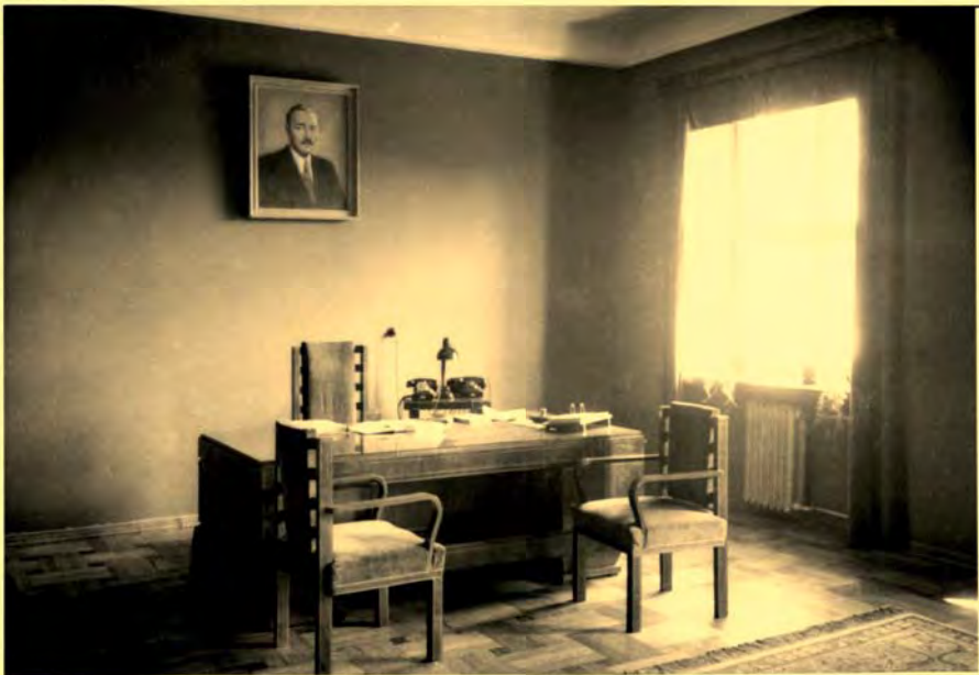
Gabinet Rektora Osmana Achmatowicza, Gmach Chemii, 1. piętro