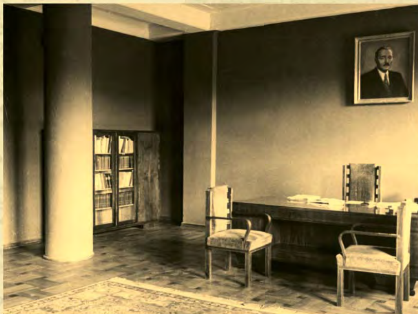
Pierwszy gabinet Rektora w budynku Wydziału Chemicznego

Historia Instytutu Elektroenergetyki Politechniki Łódzkiej, Źródło: http://www.i15.p.lodz.pl