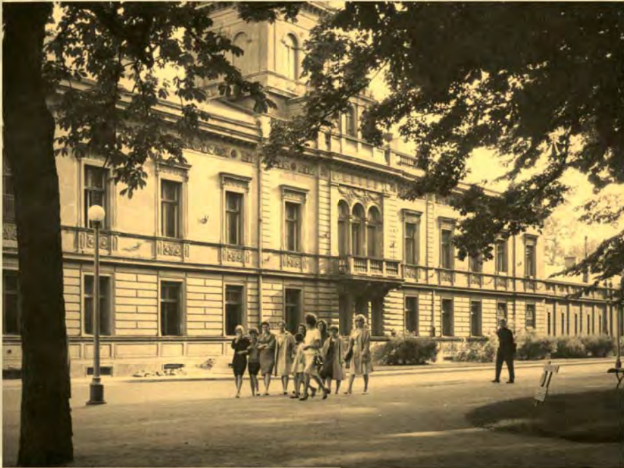
Ignacy Płażewski, Pałac Karola Scheiblera przy Placu Zwycięstwa w Łodzi. Od czerwca 1945 do 1950 r. pałac był siedzibą Politechniki Łódzkiej