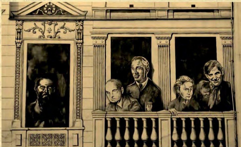
Wizerunek profesora Stefanowskiego znajduje się na fresku przy ulicy Piotrkowskiej 71, wśród innych znanych i zasłużonych dla Łodzi postaci