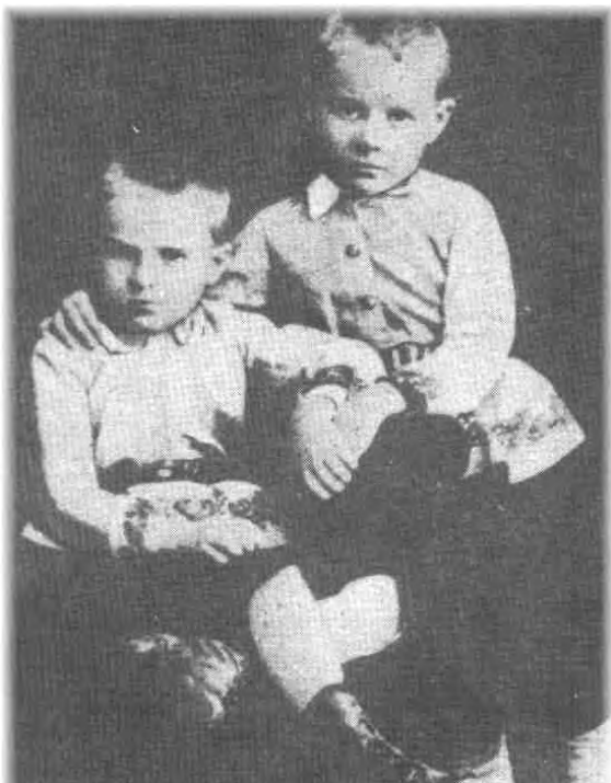
Józef (po lewej) i Bronisław (po prawej) Piłsudscy w 1871 roku.

Jego edukację przerwało aresztowanie w marcu 1887 roku za współudział w przygotowywaniu przez Frakcję Terrorystyczną Narodną Wola (Wola Ludu) zamachu na cara Aleksandra III. Warto zauważyć, że na czele niedoszłych zamachowców stał Aleksander Uljanow, starszy brat późniejszego rewolucjonisty Włodzimierza Lenina.