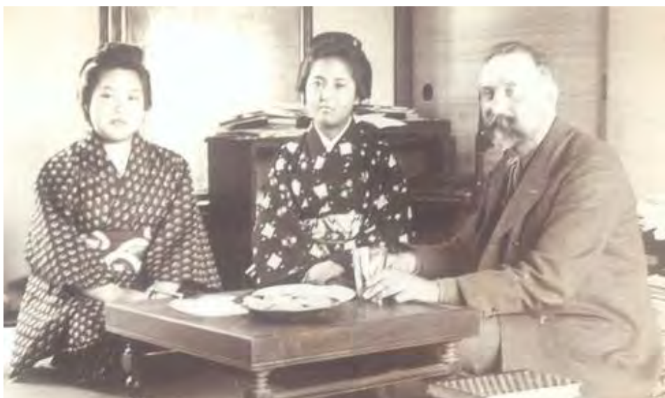
Bronisław Piłsudski podczas pobytu w Japonii.

W 1930 roku na strychu mieszkania Piłsudskiego w Zakopanem odnaleziono jego wałki fonograficzne z nagraniami Ajnów. Kolekcja ostatecznie trafiła do Uniwersytetu im. Adama Mickiewicza w Poznaniu. Po wojnie dwukrotnie polscy naukowcy próbowali przenieść je na nowsze nośniki, jednak bez powodzenia. Udało się to dopiero japońskim naukowcom z Instytutu Elektroniki Stosowanej Uniwersytetu Hokkaido w latach 80. XX wieku, którym wypożyczono te materiały. Po kilku latach zrekonstruowali i odczytali zawartość przy pomocy techniki laserowej, a także dzięki procesom chemicznym usuwającym pleśń z woskowych cylindrów. Urządzenie odpowiadające historycznemu fonografowi stworzyła firma Sony. Wreszcie uczeni przenieśli nagrania na taśmy magnetofonowe, a następnie na płyty CD.