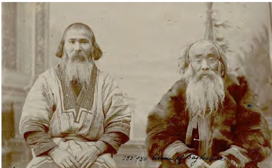
Zdjęcie autorstwa Bronisława Piłsudskiego przedstawiające dwóch Ajnów: z zachodniej (po lewej) i ze wschodniej (po prawej) części Sachalinu.

zę mieli nie wyrazić na to zgody. Piłsudski nigdy już ich nie zobaczył i nie miał z nimi żadnego kontaktu. Jego potomkowie żyją obecnie w Japonii.