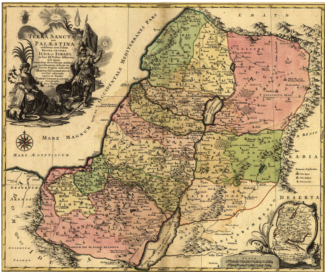
Mapa Ziemi Świętej. Autor: Tobias Conrad Lotter, 1759 rok

była krajem młodym, słabo schryścianizowanym, a w dodatku od 1138 roku rozbita dzielnicowo między potomków Bolesława III Krzywoustego. Jak już wspomniałem, podróże (a tym bardziej zbrojne ekspedycje) do odległej Ziemi Świętej były drogie i niebezpieczne, niewielu więc mogło sobie na nie pozwolić. Dlatego też w XII i XIII wieku książęta, możni i rycerze z nad Wisły zazwyczaj preferowali wyprawy przeciw pogańskim Prusom i Jadźwiniom, co było znacznie tańsze, oraz – w pewnym sensie – bezpieczniejsze. Było również bliższe, nie tylko geograficznie, ale także z perspektywy polskich interesów. Na takie rozwiązanie często przystawało samo papieństwo, zwalniając Polaków z obowiązku udziału w krucjatach na rzecz wojen z ich północnymi sąsiadami.