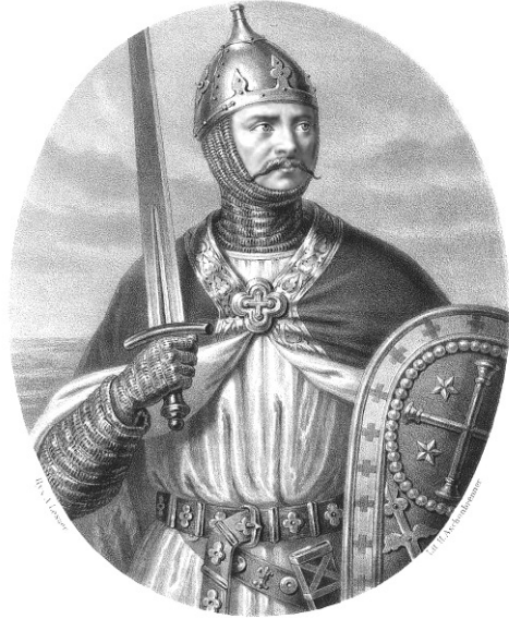
Władysław II Wygnaniec. Autor: Aleksander Lesser, XIX wiek

niemiecką Konrada III, po klęsce zadanej przez Turków Seldżuczkich pod Doryleum, spotkały w Nicei nadciągające hufce Francuzów, Czechów i Lechitów (autor konsekwentnie archaizował nazwy ludów) z ich władcami na czele. Niestety historyk nie wymienił nigdzie imienia przywódcy tych ostatnich, ale – co ciekawe – nawet w miarę poprawnie umiejscowił ich ojczyste ziemie – lokalizował je gdzieś w pobliżu zachodnich Węgier. Kronikarz nie napisał też nic o dalszych losach Polaków, być może opuścili oni Bliski Wschód razem z niemieckim królem jesienią 1148 roku po nieudanym oblężeniu Damaszku przez krzyżowców, w którym monarcha brał udział. Druga krucjata zakończyła się porażką chrześcijan.