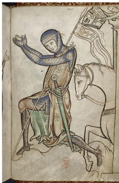
Kłęczący rycerz przed wyruszeniem na krucjatę. Psalterz z Westminster, XIII wiek, Biblioteka Brytyjska

nazwa brzmi: Suwerenny Rycerski Zakon Szpitalników św. Jana z Jerozolimy, z Rodos i z Malty). Warto zauważyć, że była to prawdopodobnie pierwsza placówka tego zakonu, jak i pierwszy zakon krzyżowy w ogóle, na ziemiach polskich. Przypuszcza się, że Henryk mógł być też fundatorem m.in. kapituły wiślickiej i kościoła św. Marcina w Opatowie.