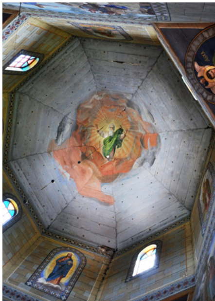
Kopuła w nawie

Złożenie do grobu – obraz w transepcie południowym