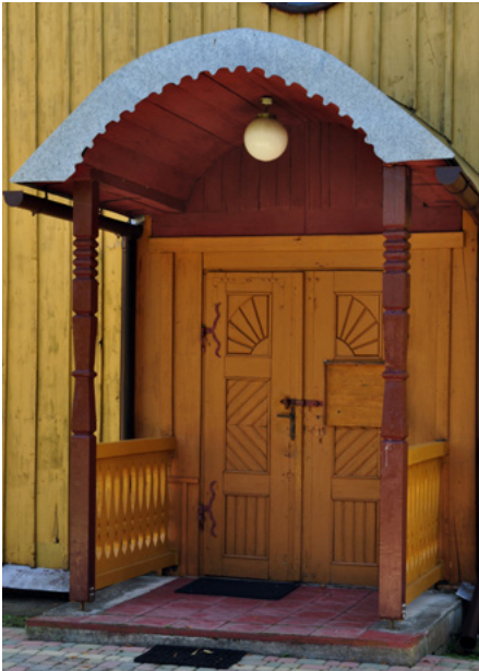
Wejście do kruchty (elewacja zachodnia)