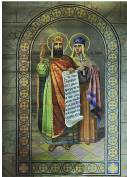
Św. Włodzimierz i św. Olga

W cerkwi zachowała się w bardzo dobrym stanie polichromia figuralna i ornamentalna, z 1937 r.