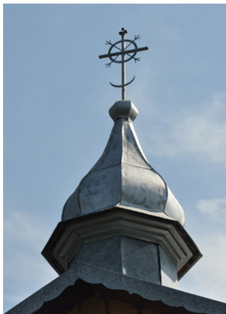
Wieżyczka nad transeptem północnym