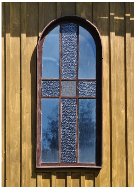
Okno prezbiterium (elewacja południowa)

Dzwonnica – słupowa, z dachem namiotowym – pochodzi z 1717 r. Została przebudowywana w 2. poł. XIX w.