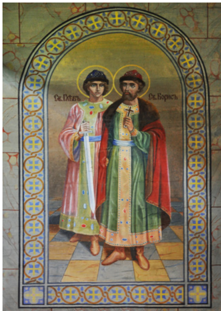
Św. Gawrył i św. Borys