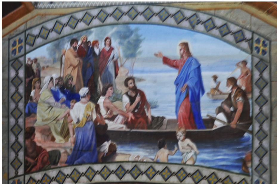
Dekoracje tambura – sceny z życia Chrystusa

Polichromie figuratywne nawiązują do tradycji cerkiewnej, ale też do malarstwa zachodnioeuropejskiego.