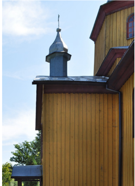
Kruchta (od strony południowej)