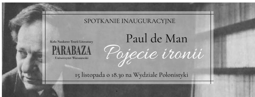
Il. 2. Grafika reklamująca pierwsze „Dysku(r)sje”