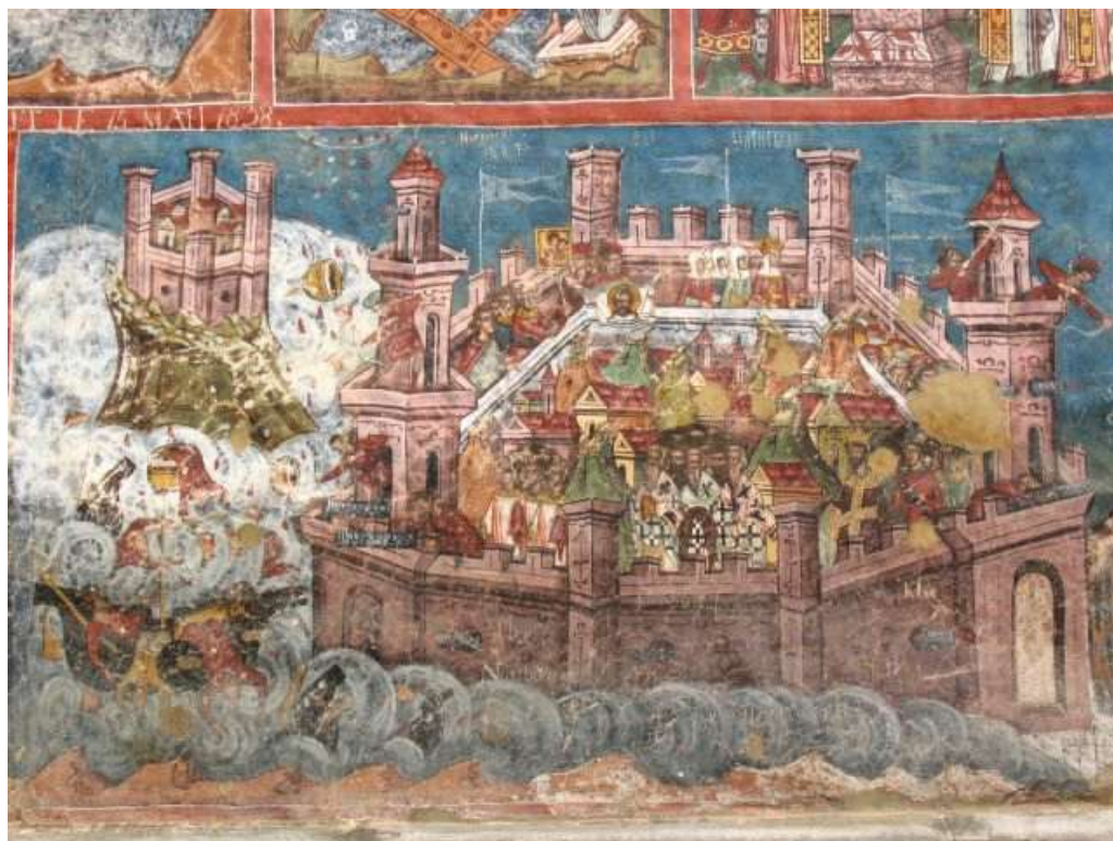
Oblężenie Konstantynopola, fresk na ścianie monasteru Moldovița.

Moldovița, ten pierwszy z oglądanych w naturze monasterów, fundowany przez hospodara Petru Raresza w 1532 roku, budzi podziw już od pierwszych chwil. Cerkiew o idealnych proporcjach i otwartym przedsionku trójjarkadowym. Mury monasteru umocnione są od strony wjazdu wieżą bramną i dwiema narożnymi basztami. Zachowała się obecnie zrekonstruowana tzw. clișarnița , piętrowy budynek mieszkalny o sklepionych pomieszczeniach, z gankiem na wysuniętych, kamiennych wspornikach na piętrze.