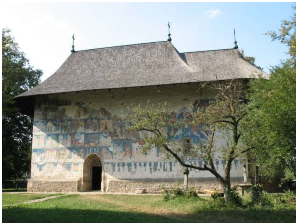
Cerkiew Ścięcia św. Jana Chrzciciela w Arbore.