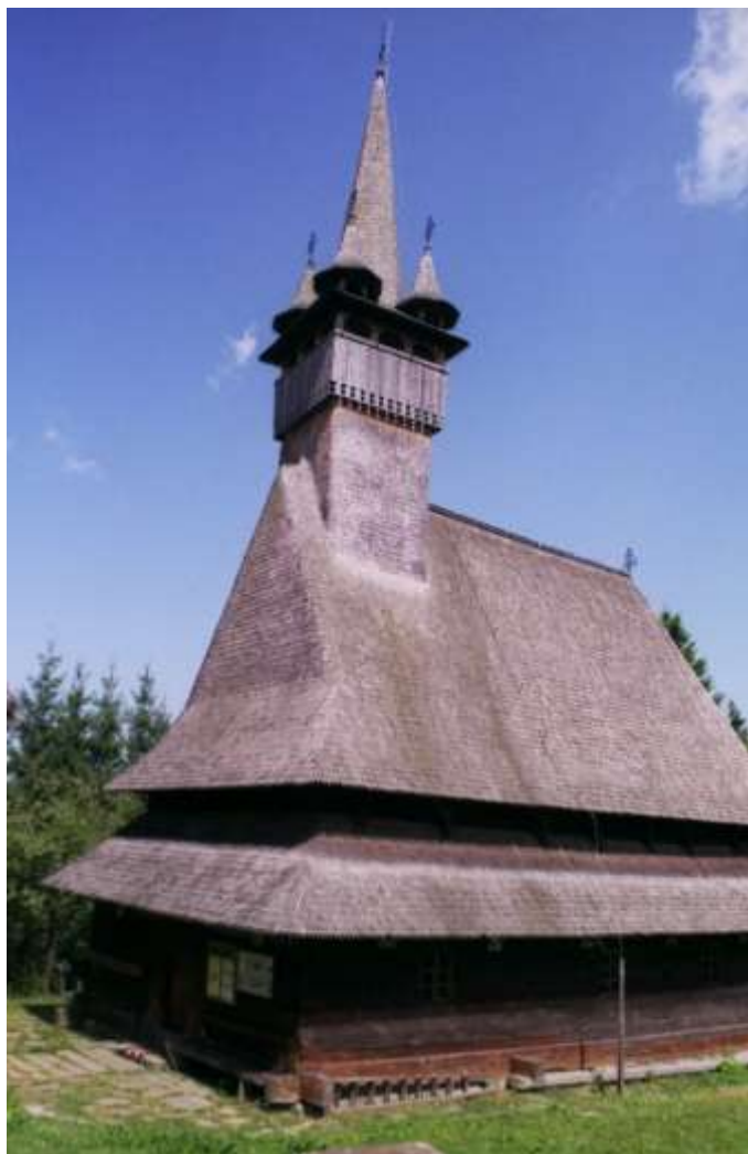
Cerkiew w Budesci.

Przekroczenie przełęczy Przysłop (1416m. n.p.m.), skąd roztacza się widok na Góry Maramureskie i grań tzw. Alp Rodniańskich. Na horyzoncie ciągnie się pas połonin. Ogromny obszar, przy którym nasze Beskidy to kieszonkowe góry. Żal jedynie hurtowo wycinanych lasów. Z przełęczy ruszamy ku Bukowinie, zmienia się styl budownictwa w wioskach, mijamy bazy transportowe, gdzie ładowane jest drewno z wycinki, drwali pracujących przy zrywce i pasące się przy drodze konie. Zapada zmrok, w wiosce Ciočanesti, przy Pensiunea Wladimir, rozbijamy namiot. Camping za 20 RON. Posiadłość zajmująca cały stok góry, sympatyczny właściciel, starszy gość, biegle mówiący po angielsku. Kolejny wart polecenia nocleg.