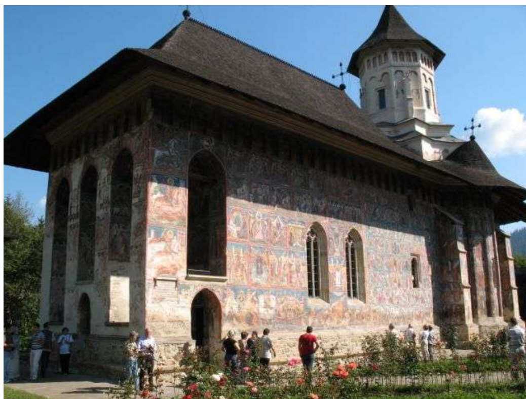
Cerkiew monasteru Moldovița.

Malarstwo z okresu panowania Petru Raresza jest fenomenem jedynym w swoim rodzaju. Zewnętrzne ściany cerkwi potraktowano jak malarskie podobrazie, dzieląc ją na kwatery i prowadząc narrację od sceny do sceny, z dominującymi kompozycjami teologicznymi i polityczno - ideowymi, które pokrywają całe powierzchnie ścian. Słońce jasno oświetla południową ścianę cerkwi, na której dominuje ogromne przedstawienie kompozycji Drzewa Jessego. Dekoracja malarska cerkwi pochodzi z 1537 r. Obrazy przedstawiające brodatych świętych i fundatorów, bo według ludowej wiary Greków, człowiek bez brody ma skłonności zbrodnicze. U podstawy polichromii przedstawienie oblężenia Konstantynopola, a na ścianie zachodniej Sąd Ostateczny. Jeszcze bardziej bogato prezentuje się wewnątrz cerkwi Zwiastowania Bogurodzicy. Przewodnik opisuje, że warto wejść na sąsiedni pagórek i spojrzeć na monaster z góry. Może i warto, ale nie należy liczyć na efektowne ujęcie fotograficzne, bo klasztor przesłaniają drzewa.