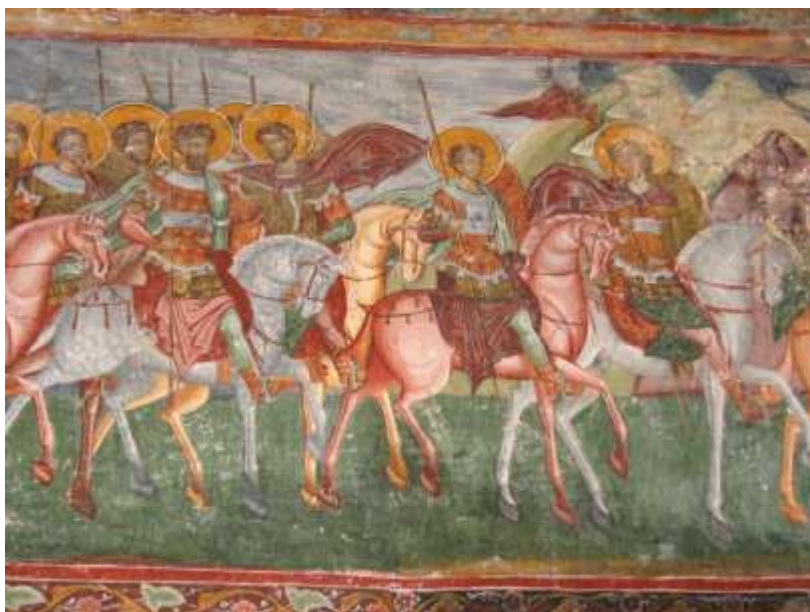
Kawalkady Krzyża Św. w Pătrăuți.

Kilka kilometrów dalej, w Pătrăuți, znajduje się cerkiew Podniesienia Krzyża Świętego, również na liście UNESCO. Zbudowana przez hospodara Stefana Wielkiego w 1487 roku, świątynia udostępniona jest do zwiedzania, w cenie „co łaska” do skarbonki. Pilnująca kościółka dziewczyna pozwala fotografować wewnątrz. W nawie głównej trwają prace restauracyjne. Na ścianie zachodniej zachowały się jeszcze fragmenty polichromii z połowy XVI wieku, przedstawiającej Sąd Ostateczny. Wewnątrz podziw budzi scena Kawalkady Krzyża Św., przedstawiająca legendę o znalezieniu Krzyża Świętego przez cesarz Konstantyna Wielkiego i jego matkę. Pochód wojowników o głowach otoczonych aureolami, posuwa się na kroczących z wdziękiem rumakach. Malowidło powstało w czasach, gdy Stefan Wielki bronił niezależności kraju i zabiegał o podjęcie antytureckiej krucjaty. Do tego programu politycznego nawiązuje tematyka fresku. Obok cerkwi wznosi się zabytkowa dzwonnica, wewnątrz której przechowywane jest kilka starych, drewnianych nagrobków.