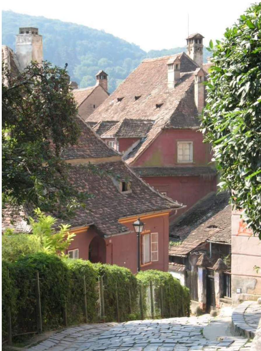
Uliczka na starówce Sighișoary.

Z pierwotnego, XIV - wiecznego kościoła zachowało się zamknięte trójbocznie dwuprzęsłowe prezbiterium o smukłych proporcjach, wieża i cztery kamienne posągi, tworzące scenę Hołdu Trzech Króli. Pozostała część trójnawowej hali świątyni pochodzi z XV w, zaś jej sklepienie sieciowe jest prawdopodobnie późniejsze. Interesujący jest południowy portal w formie ściętego trójliścia. U stóp świątyni malowniczo rozciąga się stary ewangelicki cmentarz. Warto tu wejść i pospacerować wśród nagrobków dawnych mieszkańców miasta, solidne nagrobki otoczone bluszczem to jeszcze jeden przykład dostatku, jakim wyróżniały się miasta siedmiogrodzkie.