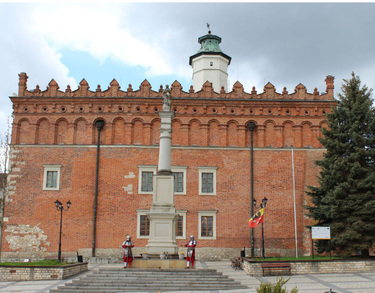
Fot. 3. Dlatego od razu rzuciła mi się w oczy straż sandomierska – dwóch rycerzy w pełnych zbrojach stojących jakby strzegąc ratusza. (Rycerze stali nieruchomo, dopiero kiedy ktoś się zbliżał, aby zrobić sobie zdjęcia ożywiali się i bardzo chętnie podchodzili do turystów)

Zdecydowałem, że najpierw zamelduję się w hotelu, w którym zamówiłem nocleg. Wybrałem jeden z dostępnych na tzw. Małym Rynku. Trzeba było najpierw przejść rynek główny, na którym o tej porze nie było jeszcze prawie nikogo.