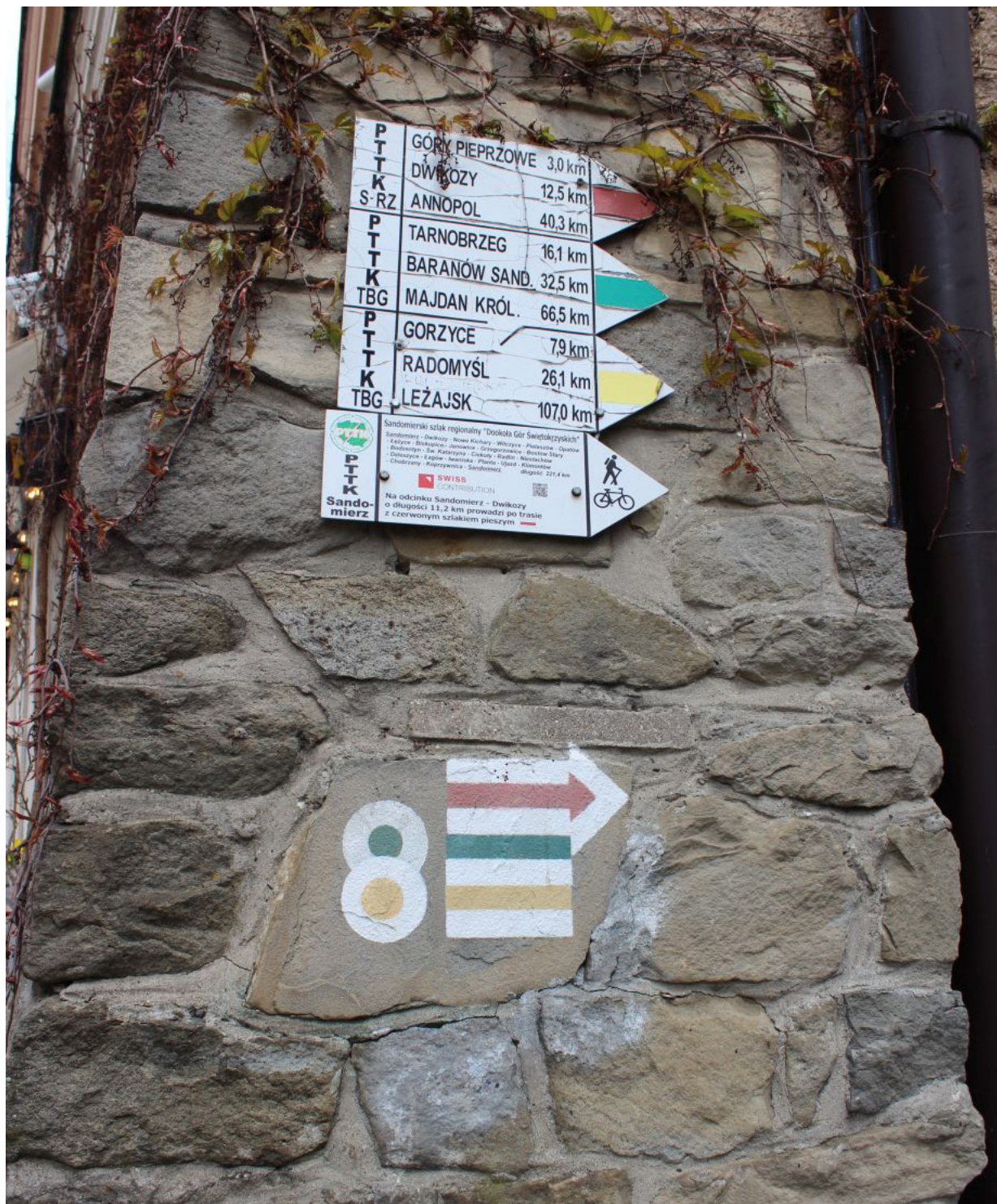
Fot. 5. Pozostało więc wyruszyć na szlak – kierunek Góry Pieprzowe (ale jak widzisz Czytelniku opcji jest wiele więcej, choć to już są trasy długodystansowe nie bardzo nadają się na wycieczkę pieszą)

Kiedy w pokoju hotelowym pozostawiłem trochę rzeczy zerknąłem na listę obiektów do zobaczenia. Niebo było zachmurzone, ale czułem, że nie będzie deszczu. Pamiętam, że kiedy wspinałem się po schodach na rynek starego miasta, idąc od stacji kolejowej, miąłłem początek czerwonego szlaku. Trzeba było się więc wrócić i namierzyć początek trasy.