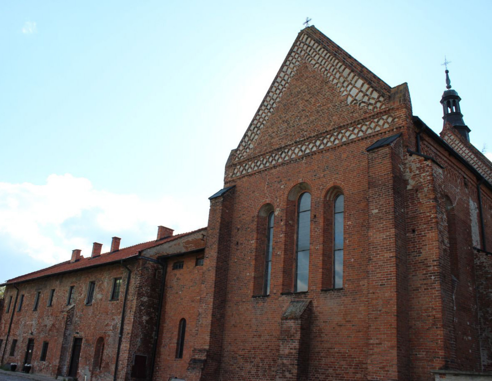
Fot.13. Kościół św. Jakuba (ze znajdującymi się nieopodal winnicami – podczas wycieczki wypilem tutaj bardzo smaczne wino z wyraźnie wyczuwalną nutą truskawki)

W samym kościele oprócz bogatego wnętrza warto zejść do krypty oraz wyjść na dzwonnice gdzie zobaczymy dzwony Jakubowe.