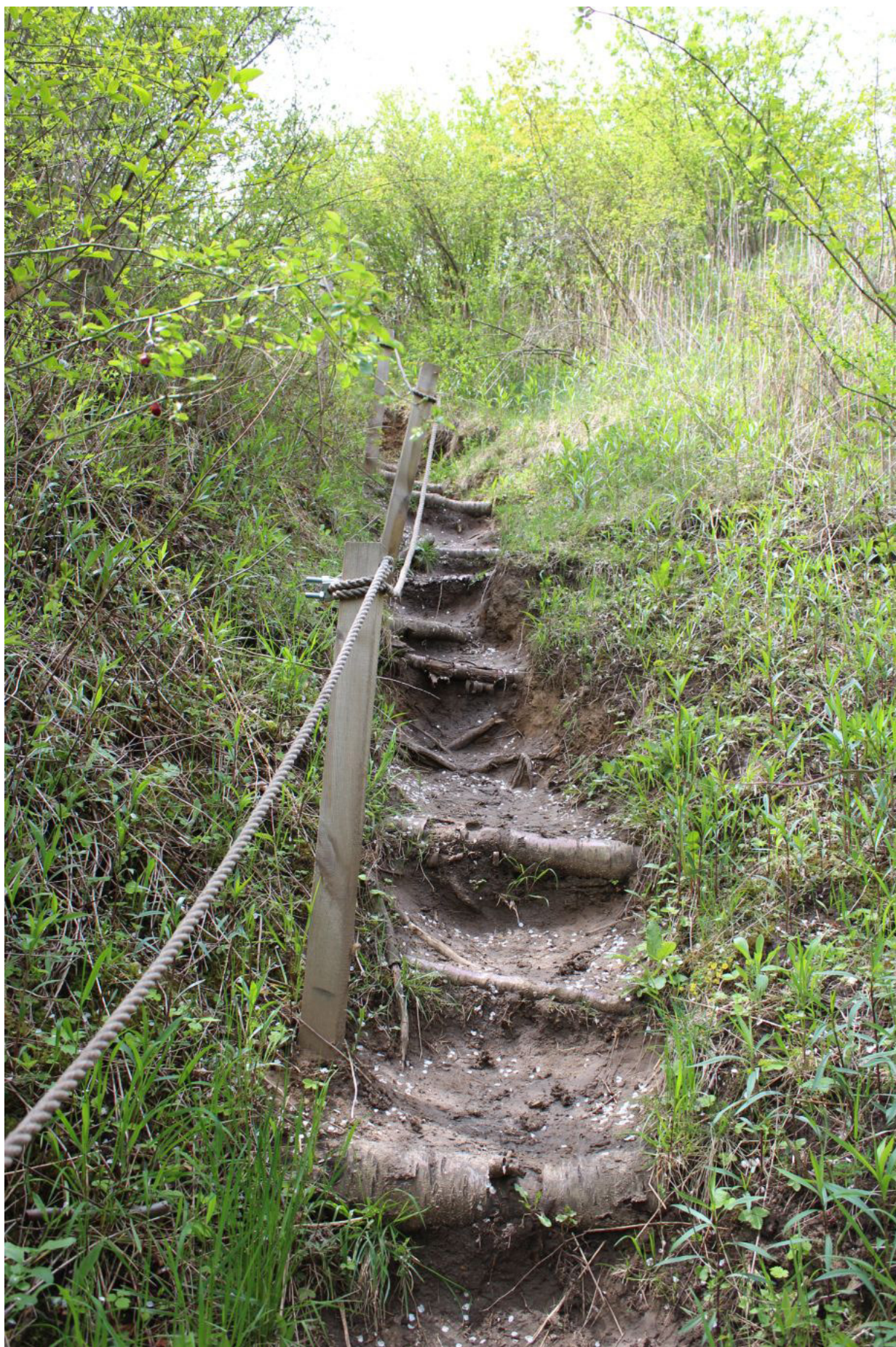
Fot. 7. Były również stromizny wraz z asekuracją w postaci solidnych konopnych lin