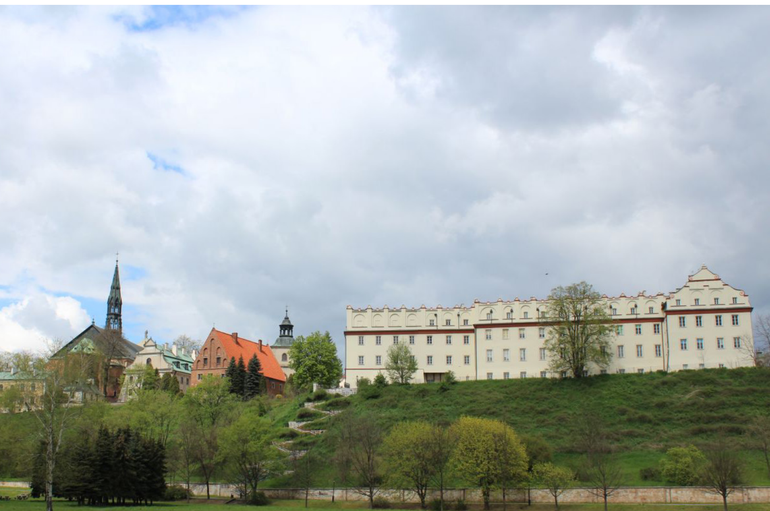
Fot. 2. Po przejściu przez most nad Wisłą zobaczyłem wzgórze sandomierskie w całej okazałości

Ciekawie zaprezentowało się miasto obejmujące potężną skarpe, które jakby „uciekało” przed Wisłą (jak wiesz Czytelniku nie tyle Wisła odsunęła się od miasta, ale to bardziej jego założyciele postanowili, po najazdach Tatarów i zniszczeniu Sandomierza, zmienić lokalizację i de facto zbudować miasto od nowa.