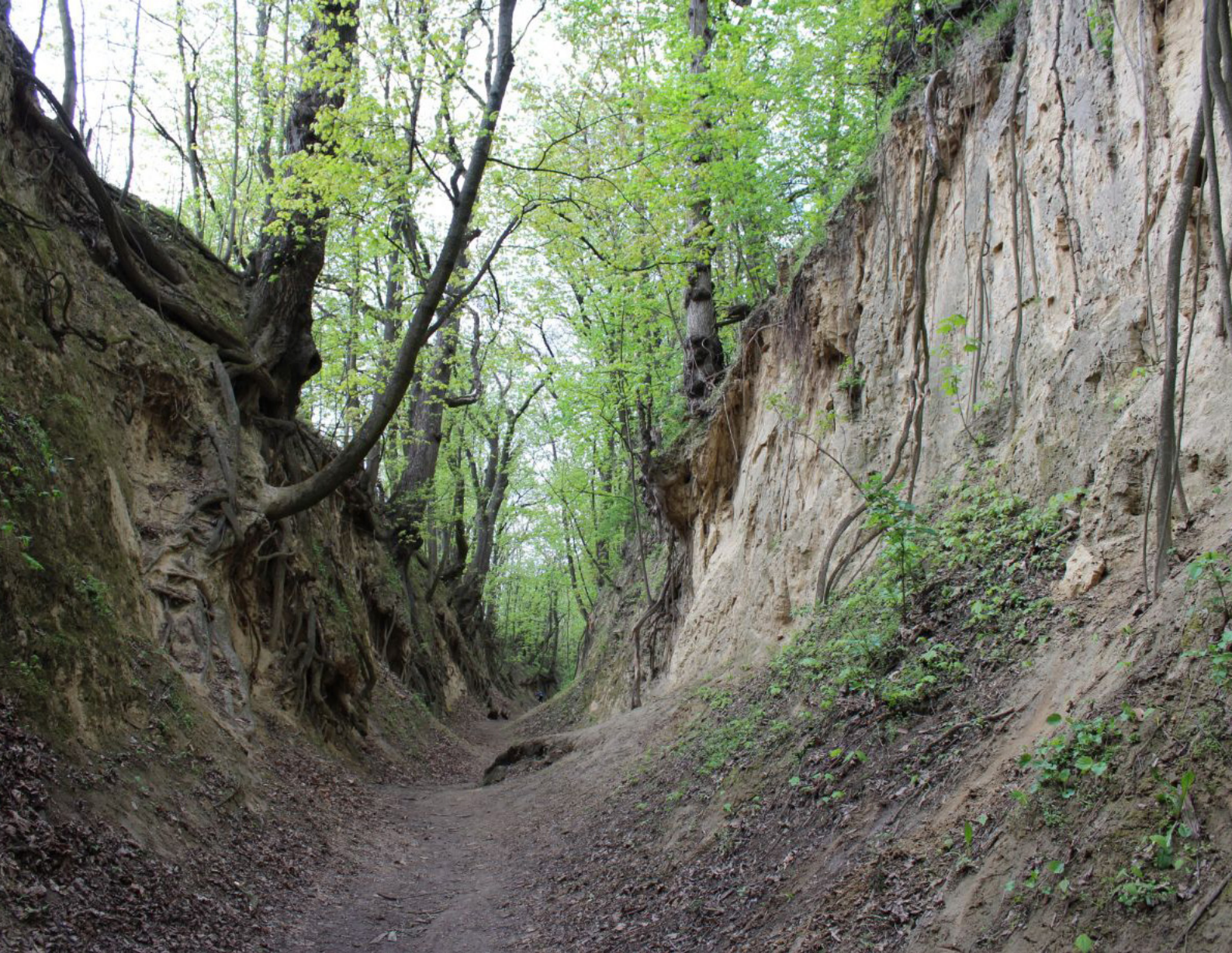
Fot. 12. Wąwóz Królowej Jadwigi to rozległy wąwóz lessowy powstały w wyniku erozyjnej działalności wód opadowych oraz gwałtownych roztopów na wysoczyźnie pokrytej warstwą lessu

Wąwóz ma około 500 m długości. Maksymalna wysokość ścian u jego wlotu osiąga ponad 10 m i w tym miejscu ściany wąwozu są najbardziej strome. Swój urok wąwóz zawdzięcza również bogatej szacie roślinnej. Na uwagę zasługują potężne korzenie, które wiją się jak zastygłe nagle w bezruchu morskie węże. Nazwa wąwozu związana jest z postacią św. Królowej Jadwigi wielokrotnie odwiedzającej Sandomierz.