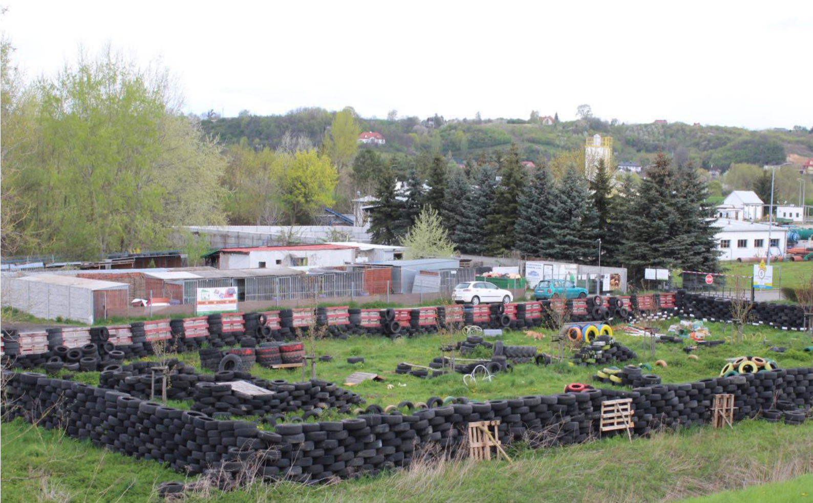
Fot. 6. Ciekawy pomysł na wykorzystanie zużytej gumi, która już najwidoczniej nie nadawała się do wulkanizacji

Wobec tego zlokalizowałem znajome miejsce i ponownie zszedłem na dół kierując się na zachód. Miałem do przejścia 3 km (idąc ulicą Krótką następnie schodząc długimi schodami do ulicy Browarnej wzdłuż ruchliwej Żwirki i Wigury) i kiedy znalazłem się już poniżej sandomierskich wzgórz, skręciłem od wspomnianej głównej arterii, na polną ścieżkę, idąc ciągle za znakami. Ciekawe jest to, że po zejściu z głównej drogi (początkowo szedłem chodnikiem) szlak zbliżył się do Wisły i zaczął się oddalać od wielkiego sznura samochodów osobowych i ciężarówek. Teraz miałem dwie opcje: wędrować niedaleko koryta rzeki bądź po wale przeciwpowodziowym. Z góry było lepiej widać więc wybrałem ten wariant. Nie patrzyłem na mapę ponieważ szlak prowadził prościutko w kierunku Gór, które już z oddali były dobrze widoczne. Pamiętam, że czytając mapę, jeszcze w pociągu, powinienem minąć oczyszczalnię ścieków. Tym razem jej charakterystyczny zapach powiedział mojemu nosowi, że idę w dobrym kierunku. Tymczasem zaciekawiał mnie tor przeszkód zbudowany ze starych zużytych opon.