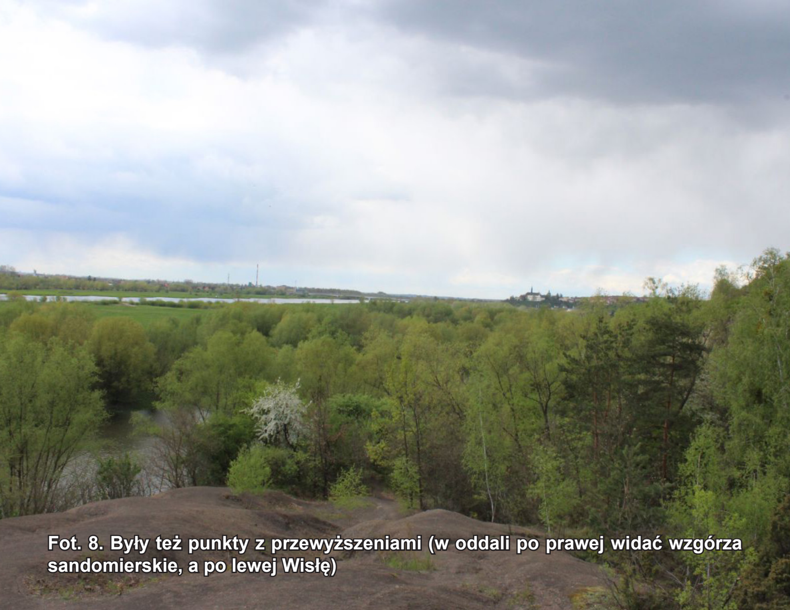
Fot. 8. Były też punkty z przewyższeniami (w oddali po prawej widać wzgórza sandomierskie, a po lewej Wisłę)