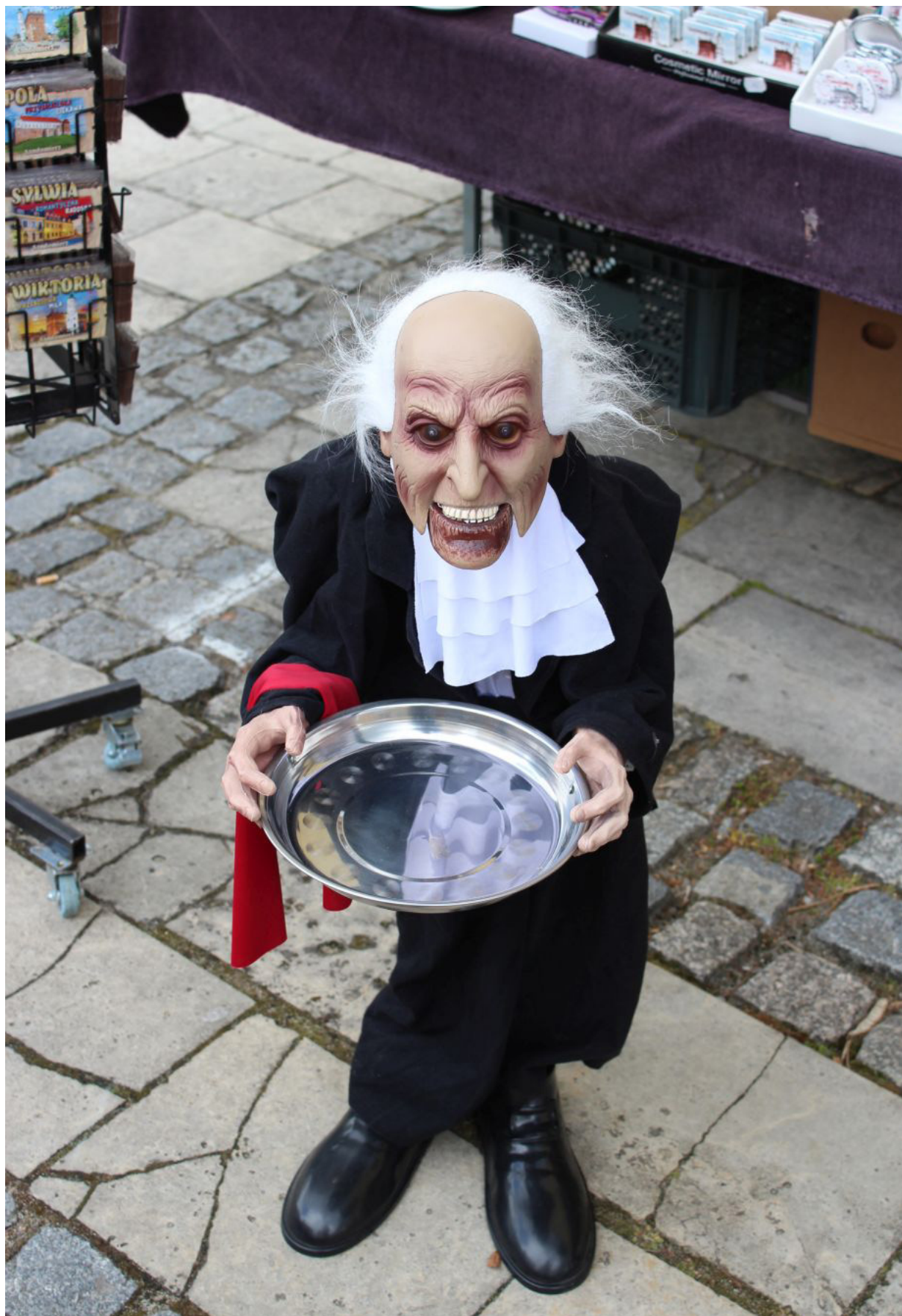
Fot. 4. Na jednym ze stoisk zaciekała mnie upiorna figurka służącego – czy to postać z zamku Drakuli czy należy może jednak do lokalnego folkloru?

Kiedy dotarłem do hotelu zwróciłem jeszcze uwagę na stragany okalające mały plac – drugi rynek znajdujący się za plecami czyli na północ od Rynku właściwego.