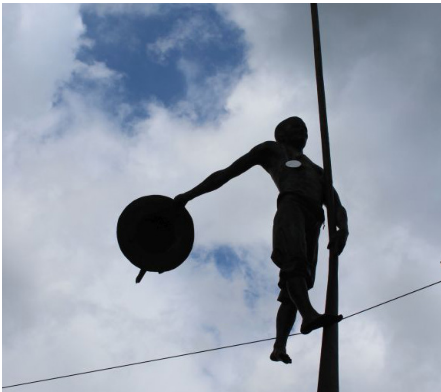
Fot. 1. Rzeźba flisaka idącego po linii przed Bramą Opatowską to jeden z symboli Sandomierza