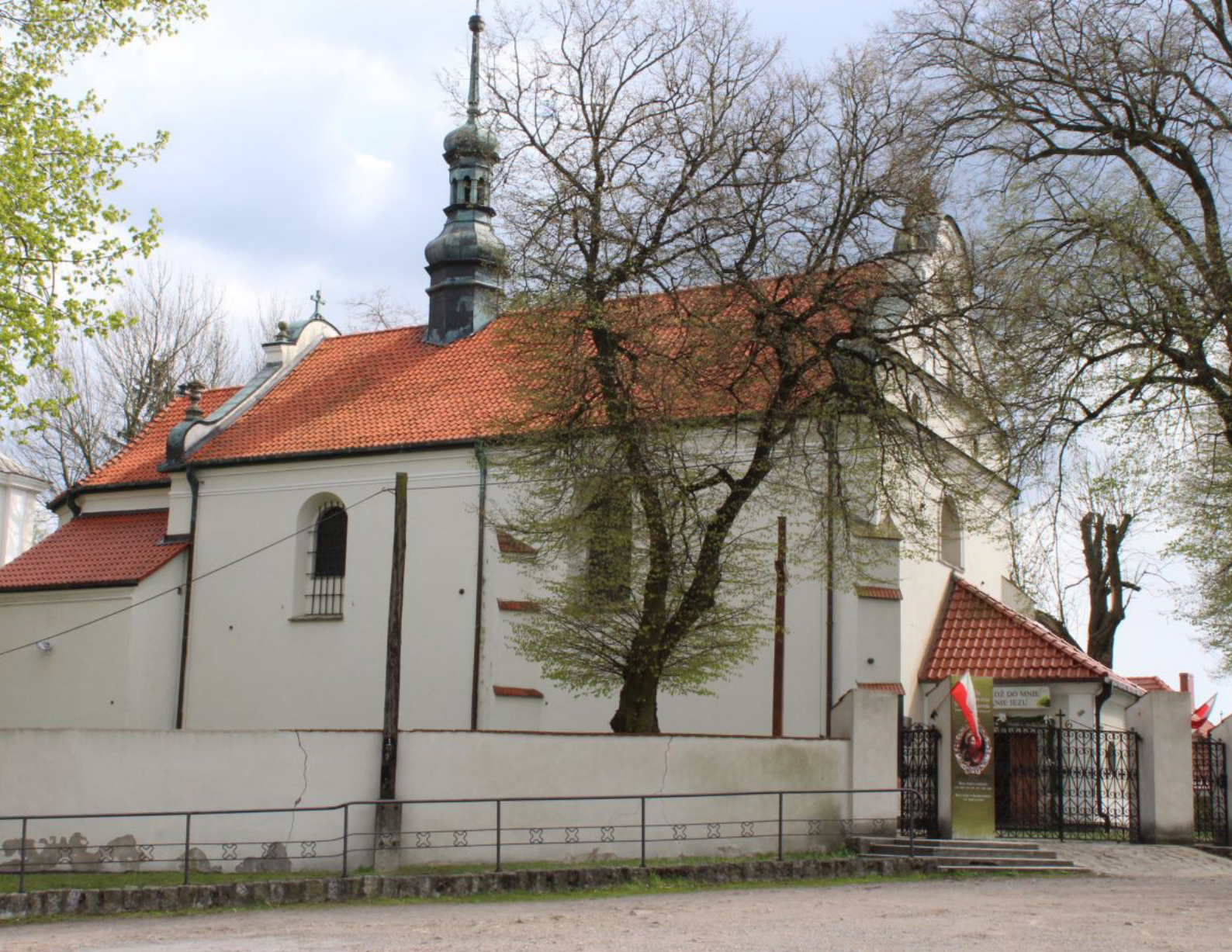
Fot. 11. Kościół pw. Nawrócenia św. Pawła - powstał on w miejscu zniszczonej drewnianej świątyni w latach 1426-1434, pod względem architektonicznym łączy w sobie styl gotycki, renesansowy i barokowy, w 1718 roku dobudowano do nawy głównej kaplicę św. Barbary

Pierwszym skojarzeniem był Wąwóz Korzeniowy z Kazimierza Dolnego, leżącego też nad królową naszych rzek, ale ten okazał się być szerszy, wyższy i bardziej stromy. Znajduje się na zachód od Starówki.