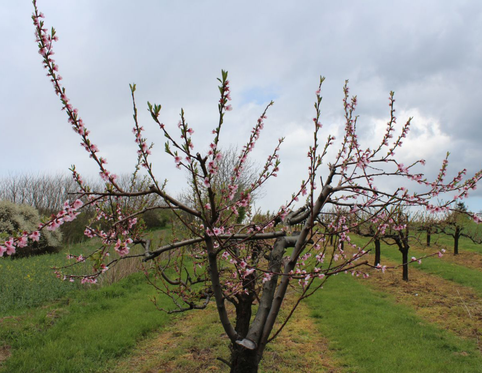
Fot. 10. W Rezerwacie Górach Pieprzowych znajduje się największe naturalne Rosarium w Europie – tutaj jest widoczna wiśnia karłowata

Miejsce nazywane w okolicy Pieprzówkami jest niezwykłym zakątkiem. Murawy, łąki, róże można spotkać w wielu zakątkach Europy, więc pojedynczo nie ustanawiają one wyjątkowości tego rezerwatu. Jego podstawowy urok polega na obecności wszystkich atrakcji jednocześnie. Znajdziemy tutaj murawy stepowe, róże, łąki, źródliska, las łąkowy, starorzecze Wisły, sady morelowe, widok na morze lasów, widok Sandomierza, wiele rzadkich owadów, ptasie przeloty. Owa wielorakość jest sednem Pieprzówek.