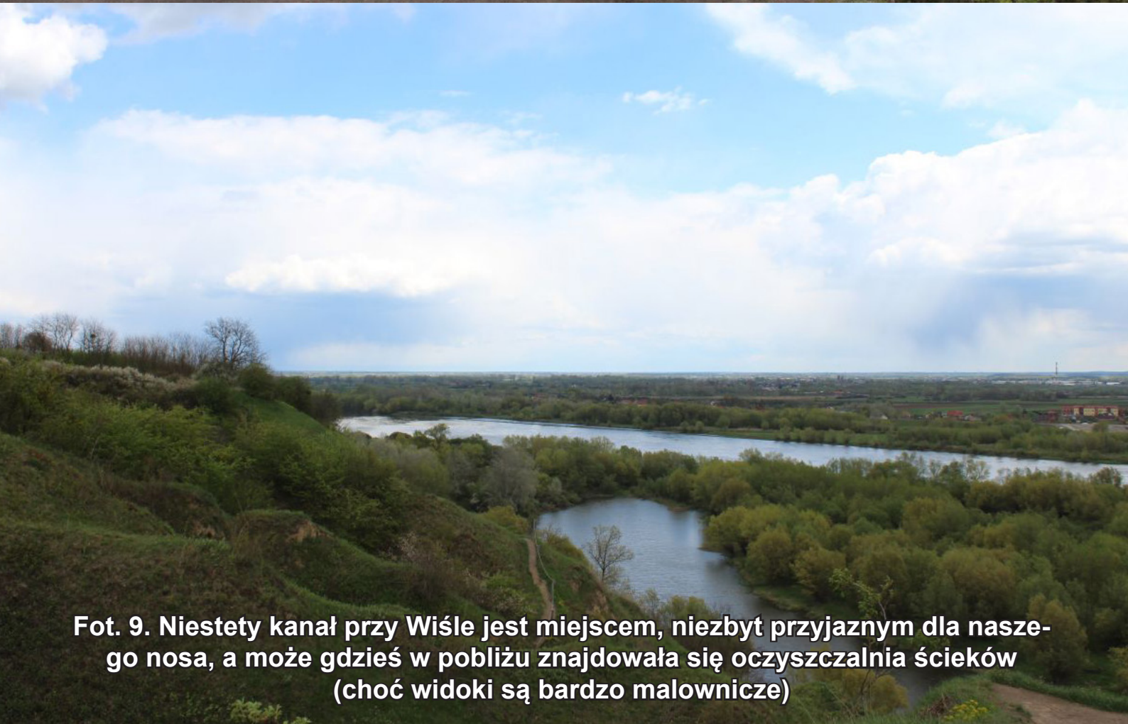
Fot. 9. Niestety kanał przy Wiśle jest miejscem, niezbyt przyjaznym dla naszego nosa, a może gdzieś w pobliżu znajdowała się oczyszczalnia ścieków (choć widoki są bardzo malownicze)