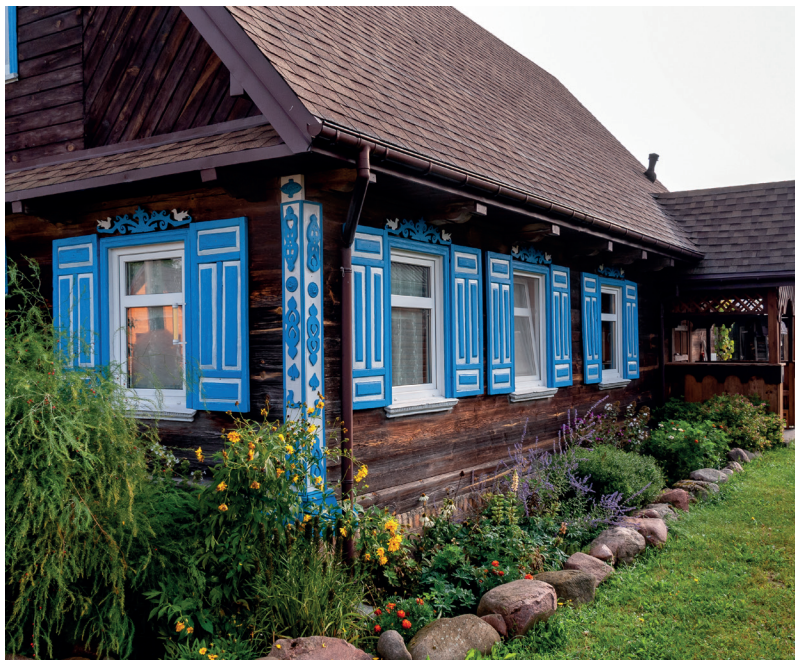
▲ Kraina Otwartych Okienic – Soce

W PUCHŁACH (4,5 km na południowy zachód od Trześcianki) najładniejszym obiektem jest ★ cerkiew Opieki Matki Bożej . Błękitną, drewnianą budowlę z detalem malowanym na ciemny i biały kolor zdobią liczne dekoracje snycerskie. Obecną świątynię zbudowano w latach 1913–19. Stoi w miejscu, gdzie w XVI w. podobno objawiła się Matka Boska. Najciekawszą wsią w okolicy są ★ SOCE (5 km na północ od Puchłów). To tak naprawdę dwie ulicówki, między którymi przepływa rzeczka Rudnia. Północna część wsi nazywana jest Mokrawy, południowa zaś – Suchlany. Do dziś w obu zachowały się zdobione, kolorowe domy. Najlepszym rozwiązaniem jest spacer jedną częścią wsi i powrót drugą. Przy wjazdach do Soców stoją krzyże wotywnne . Najciekawsze są te przy drodze do Trześcianki. Przy drodze do wsi Puchły