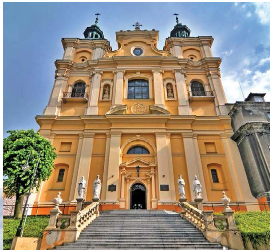
▲ Fasada soboru grekokatolickiego

Do lat 20. XVI w. system obronny Przemysła miał charakter ziemno-drewniany. W 1. poł. XVI w. wzniesiono kamienne mury obronne z dziewięcioma basztami oraz trzema bramami umożliwiającymi wjazd do miasta (Lwowską, Grodzką, prowadzącą na zamek, oraz Wodną nad Sanem). Pod koniec XVIII w. Austriacy nakazali rozebranie niemal całych fortyfikacji. W najlepszym stanie fragmenty kamienno-ceglanego muru zachowały się na tyłach karmelu przy