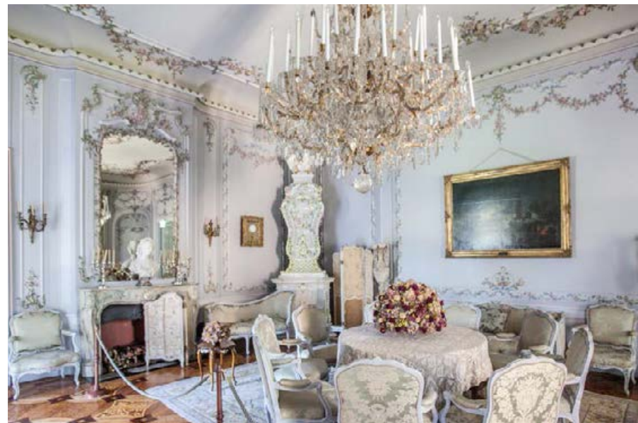
▲ Pałac w Łańcutie, Salon Narożny