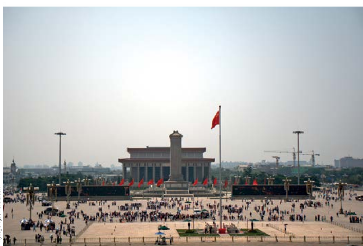
Plac Tian'anmen, w tle Mauzoleum Mao Zedonga

Obelisk o wysokości 38 m wzniesiono w 1958 r. po północnej stronie Mauzoleum Mao Zedonga. Zdobiące go płaskorzeźby ilustrują momenty ważne dla rewolucji ludowej, począwszy od wojen opiumowych. Straż pełnią przy nim żołnierze, w związku z czym nie sposób podejść do samego obelisku – można go tylko obejść.