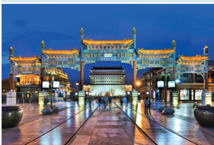
Plac Tian'anmen nocą

największy plac na świecie, który bez trudu mógłby pomieścić dwadzieścia stadionów piłki nożnej. Jest to miejsce wiecznie tętniące życiem, choć zasłynęło przede wszystkim z tragicznych wydarzeń z czerwca 1989 r., bardzo nagłośnionych w mediach (zob. s. 29). Plac Tian'anmen został znacznie powiększony w latach 50. XX w., aby podczas uroczystości państwowych zmieściły się na nim setki tysięcy zwolenników reżimu.