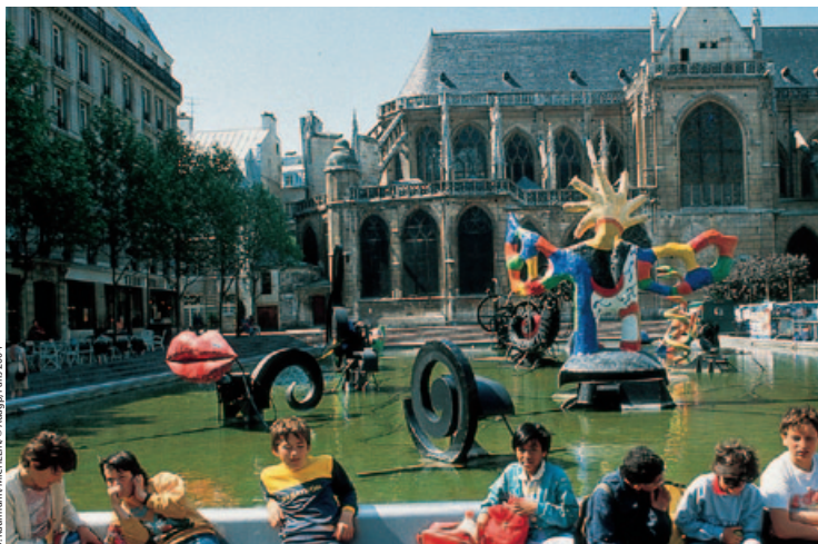
B. Kaufmann/MC/ELINE © Adagio, Paris 2004