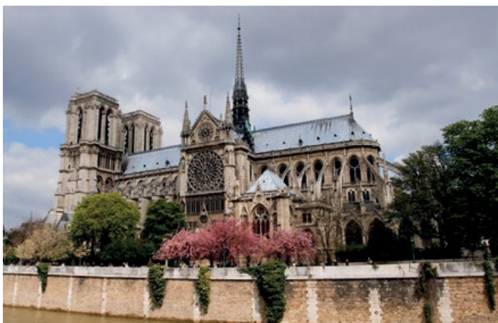
▲ Katedra Notre Dame od strony Sekwany

Pokruszone mury i zarysy ulic dawnego miasta, obecnie znajdujące się pod powierzchnią ziemi, dają wyobrażenie o tym, jak żyło się w Lutecji 2 tys. lat temu. I nie tylko wtedy – muzeum bowiem przybliży również miasto średniowieczne. To doskonale miejsce dla tych, którzy chcieliby „cofnąć się w czasie”.