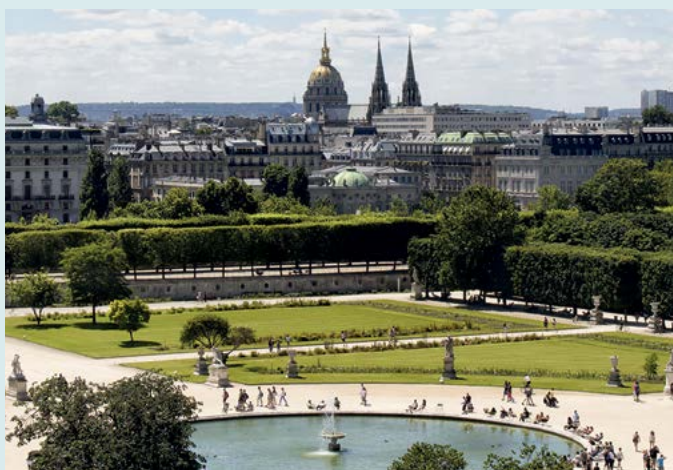
Jardin des Tuileries

Warto przysiąść na jednym z krzeseł rozstawionych naprzeciwko ośmiobocznej sadzawki w Jardin des Tuileries i rozkoszować się widokiem: perspektywą placu Zgody, Pól Elizejskich i dzielnicy La Défense z jednej strony, a ogrodów Tuileries i Luwru z drugiej. (Zob. s. 122).