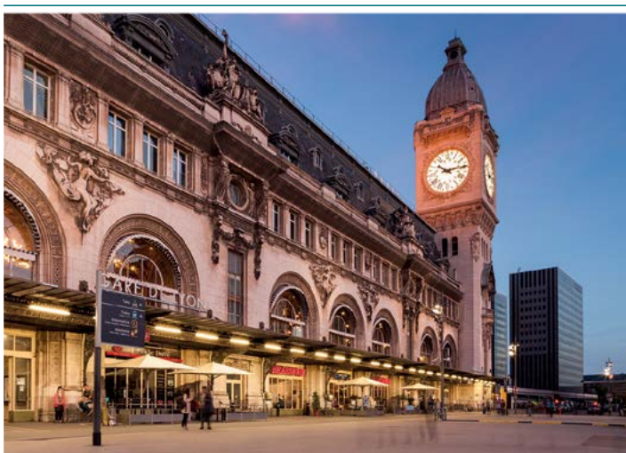
Gare de Lyon

Podróż samochodem to dosyć wygodny sposób na dojazd do Paryża, i tani, jeśli na benzynę składa się kilka osób.