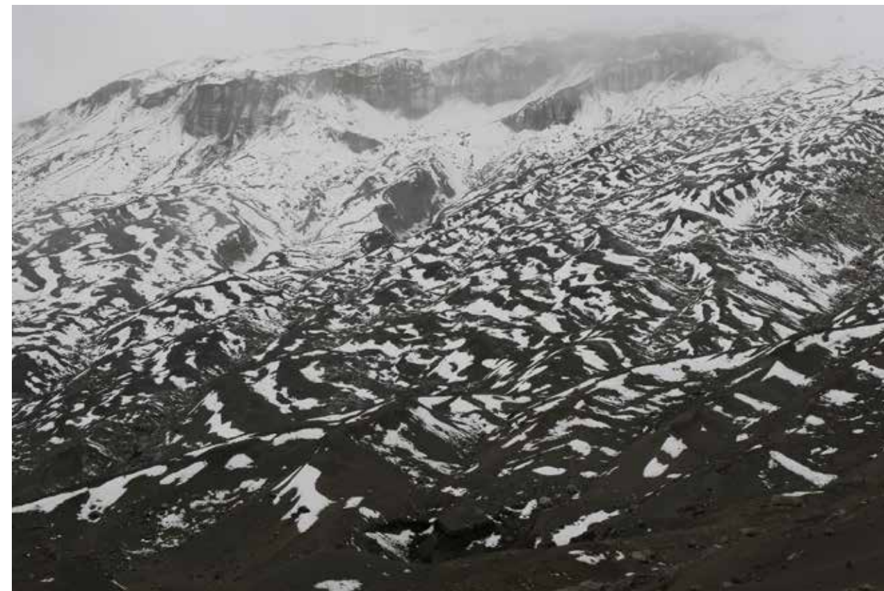
Park Narodowy Los Nevados