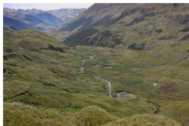
Park Narodowy Sangay

Idzie się w kaloszach i nieprzemakalnych ubraniach. Na początku szlak prowadzi przez mokradła i strumienie. Z otwartej przestrzeni z widokiem na dolinę z krętą rzeką, wodospadami i ośnieżonymi szczytami oraz jeziorem wchodzi się na stromo spadający teren z błotem po kolana, gdzie maczetą trzeba torować sobie drogę przez chaszczę i walczyć z kaloszami zasysającymi się w bagienku. Chaszczę i drzewa tworzą dach nad głową i nie widać nieba. Ponieważ pada prawie codziennie, roślinność jest bujna jak w dżungli. Nie lubię porównań, ale to miejsce przypominało mi Nową Zelandię.