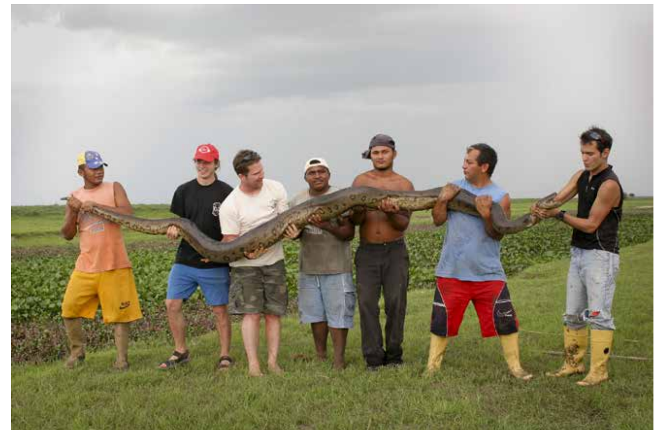
Anakonda z Los Llanos

Ostatniej nocy niewiarygodna burza z piorunami, które oświetlały całe niebo tak mocno, że było jasno jak w dzień, a do tego bardzo głośno.