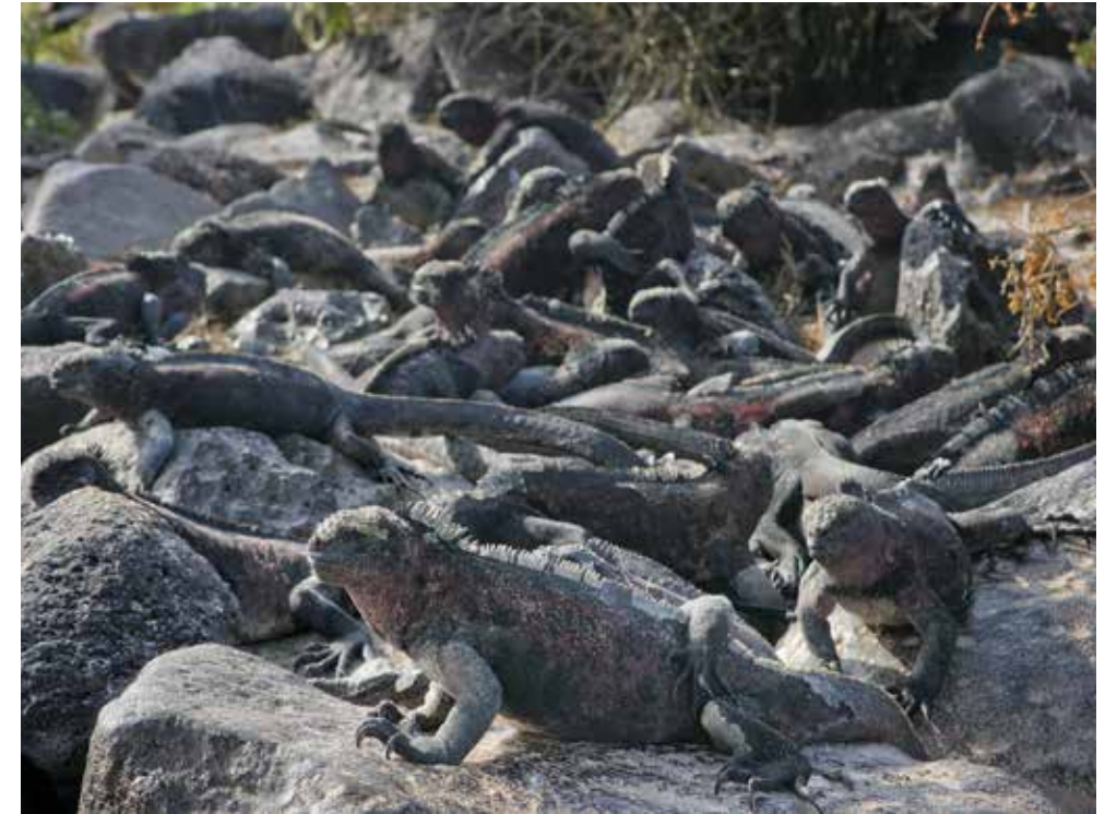
Zwierzęta z Los Galapagos

Przeziębienie kurowałam w górskiej hacjendzie z widokiem na Cotopaxi, obłożona dwoma dalmatyńczykami i dwoma jamnikami, ulokowana przy kominku. Tego typu paradiso prowadzą zazwyczaj obcokrajowcy zaślubieni z lokalnymi pięknosciami.