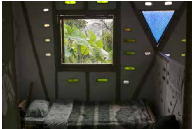
Hostel La Casa de François

Pożegnałam Manizales i wyruszyłam do San Augustin. Podróż trwała jedyne osiemnaście godzin, a końcowy odcinek trasy był jak z koszmaru. Na ogół autobusy, szczególnie nocne, są superkomfortowe, nowiutkie, z klimatyzacją i lotniczymi siedzeniami, ale tym razem pojazd był mały i rozgruchotany. Telepał się po wybojach, o oparciu głowy nie miałam co marzyć – tak trzęsło, że myślałam, że mi odpadnie. Autobus nie dość, że mały to na dodatek kompletnie wypchany. W wąskim korytarzu przez siedem godzin stały osoby z bagażem. Jeden senior trzymał kury i tylko czułam jak się załatwiają. Mimo spartańskich warunków oczywiście w autobusie nie zabrakło telewizora i raczono nas filmem akcji z jednocześnie na full włączoną muzyką. Film zatrzymywał się na wybojach, ale kierowca nie dawał za wygraną i uparcie przewijał taśmę. Widziałam to „dzieło” chyba ze trzy razy.