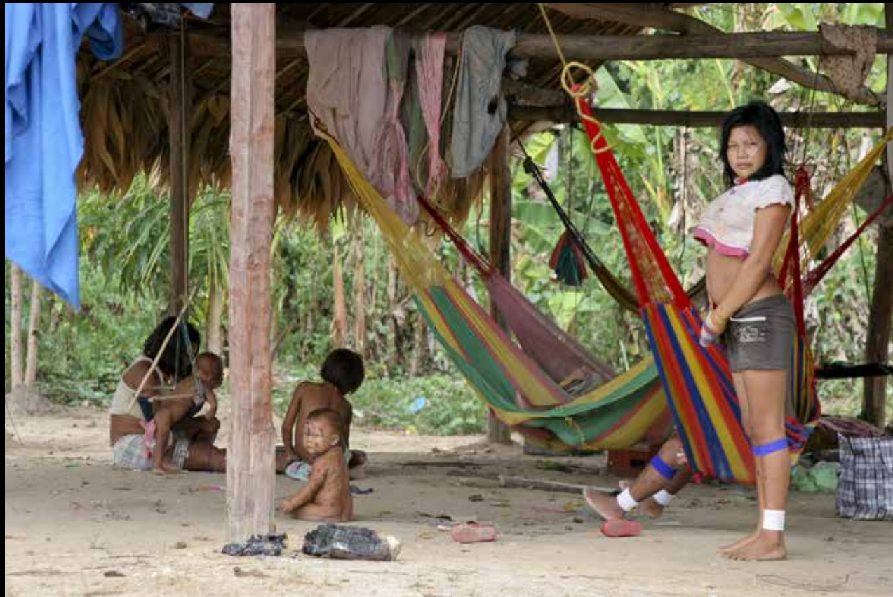
Mieszkańcy wioski nad Rio Cuaro