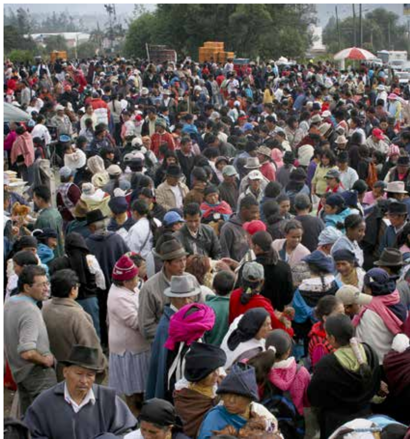
Targ w Otavalo