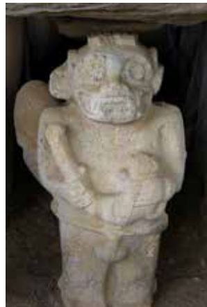
Posąg z San Augustin