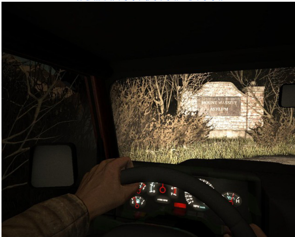
Sielankowa jazda samochodem do zakładu

Grę rozpoczniesz pojawiając się w samochodzie. Po krótkiej scenie ukazującej jak dojeżdżasz do starego, ponurego dworu twoja postać weźmie swoją teczkę i wyciągnie z niej kartkę z wiadomością. Przeczytaj ją, naciśnij „Close” u dołu listu, a twoja postać wysiądzie z samochodu