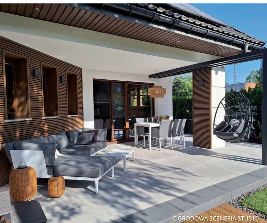
OGRODOWA SCENERIA STUDIO

Jednym z kluczowych pojęć we współczesnym projektowaniu jest harmonia. Dotyczy ona nie tylko stylu, ale także sposobu użytkowania przestrzeni. Ogród i taras nie są już traktowane jako osobne byty. Stanowią logiczną kontynuację wnętrza domu. Jednolitość ta widoczna jest w materiałach, kolorystyce i proporcjach. Naturalne drewno, kamień, beton architektoniczny i stonowane tkaniny pojawiają się zarówno we wnętrzach, jak i na zewnątrz. Dzięki temu granica pomiędzy do-