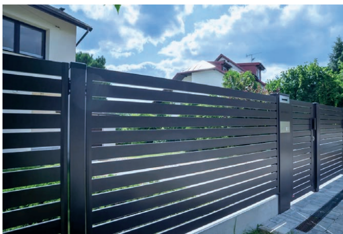
Model P82. Ogrodzenie metalowe Konsport z poziomym układem wypełnienia. KONSPORT , www.konsport.com.pl

Budowa ogrodzenia o wysokości do 2,2 metra nie wymaga ani pozwolenia na budowę, ani zgłoszenia w urzędzie. Oznacza to, że inwestor może rozpocząć prace bez konieczności przechodzenia przez formalną procedurę administracyjną pod wa-