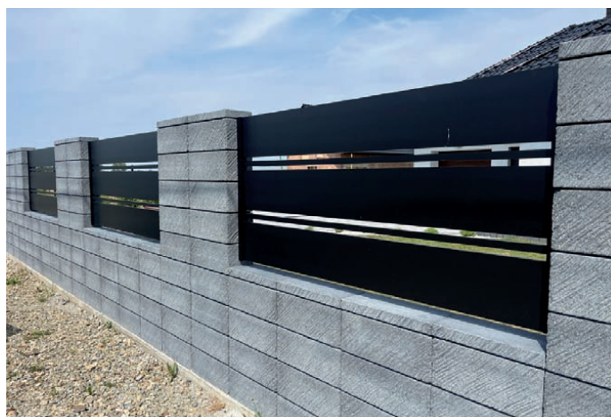
Ogrodzenie aluminiowe Model A.13.01. Nowoczesne ogrodzenie wykonane przez firmę Pekamet z poziomych profili 250×20 mm oraz 30×20 mm. Minimalistyczna forma podkreśla nowoczesną architekturę domu, zapewniając trwałość, estetykę oraz wysoki poziom prywatności. PEKAMET , www.pekamet.pl