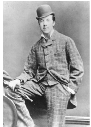
Oscar Wilde w Oxfordzie, 1876