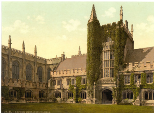
Magdalen College, Oxford, między 1890 a 1900

Lipiec – w „The Dublin University Magazine” opublikował pierwszą próbę dziennikarską The Grosvenor Gallery – sprawozdanie z wystawy w Grosvenor Gallery.