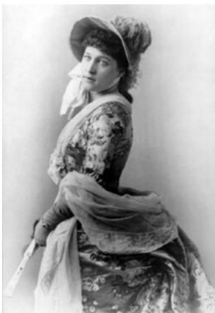
Lillie Langtry, 1882