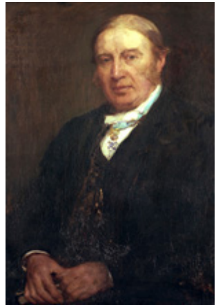
John Pentland Mahaffy, ok. 1918 Autor portretu: Walter Osborne

Marzec–kwiecień – zwiedził Rawennę (swoje wrażenia wykorzystał, tworząc w 1878 r. poemat