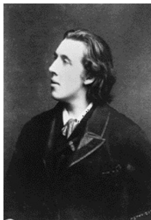
Oscar Wilde w 1881