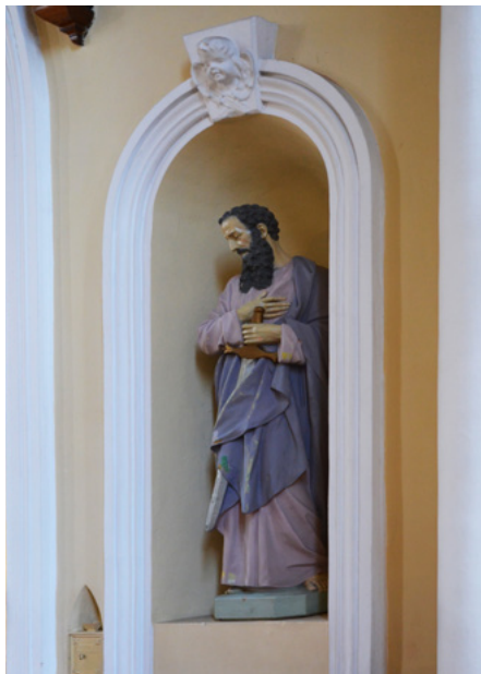
Figura św. Pawła