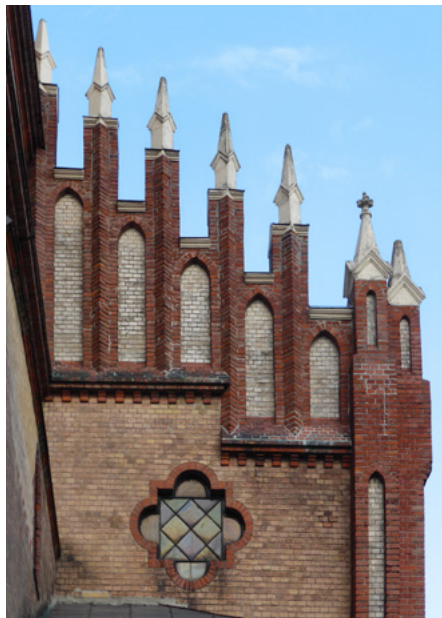
Pinakle zdobiące szczyt elewacji zachodniej

Projekt wykonał wybitny architekt Józef Pius Dziekoński, ale potem zmiany wprowadził Władysław Łaszkiwicz.