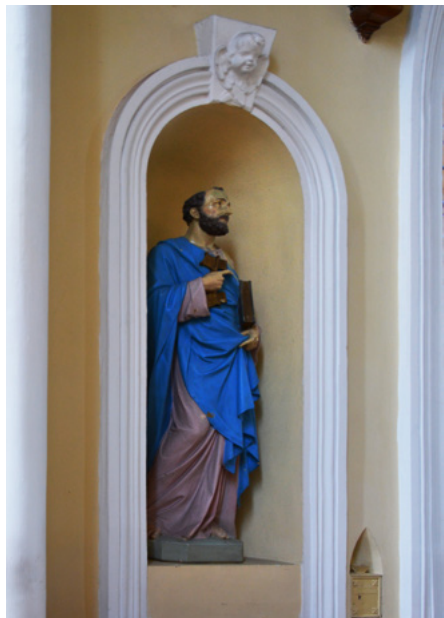
Figura św. Piotra

W nawie głównej jest sklepienie gwiaździste, w bocznych – krzyżowo-żebrowe.