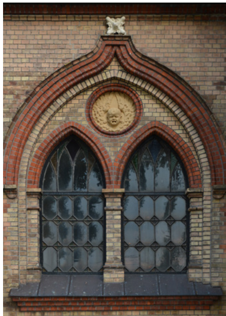
Okna w kruchcie (biforia), elewacja zachodnia