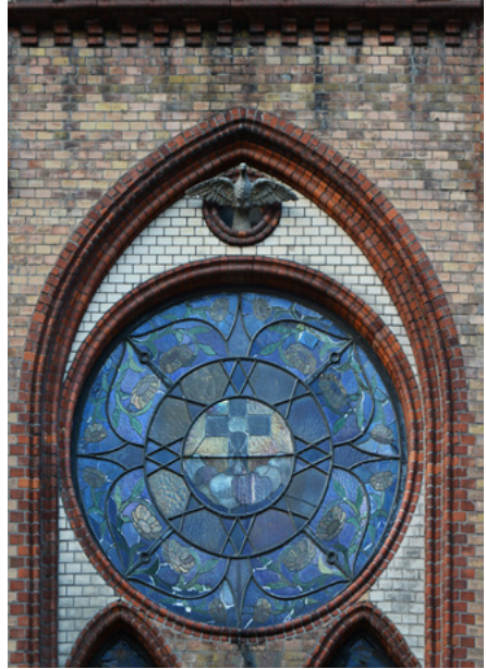
Elewacja południowa, transept południowy

Prezbiterium jest prostokątne, zamknięte trójbocznie, z rzeźbiarskim przedstawieniem sceny ukrzyżowania Jezusa.