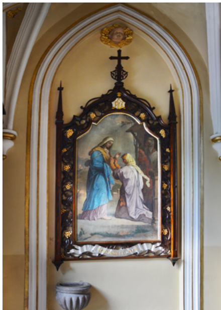
Obraz Matki Boskiej w kruchcie