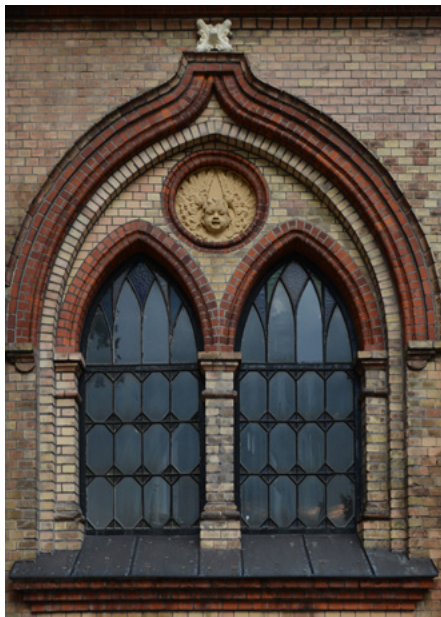
Fot. Krzysztof Pol