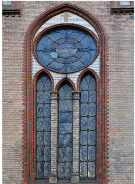
Okno (triforium) w transepcie (elewacja północna)

W kościele są trzy ołtarze z drewna dębowego. W ołtarzu głównym jest obraz Niepokalanego Poczęcia NMP (fot. z prawej).