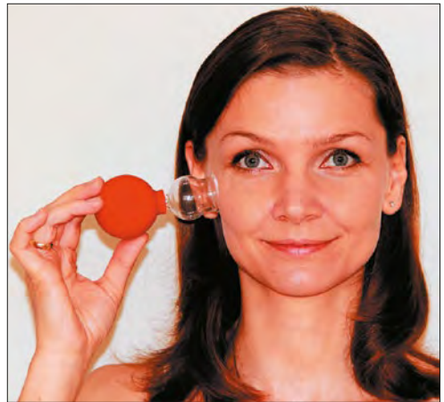
Masaż bańką nie jest skomplikowany i w krótkim czasie przynosi znakomite efekty.

Bardzo ważne jest, by najpierw skórę oczyścić i obficie nanieść olejek. Podczas masażu bańką to, co jest na powierzchni skóry wtlaczamy w głębsze warstwy tkanki.